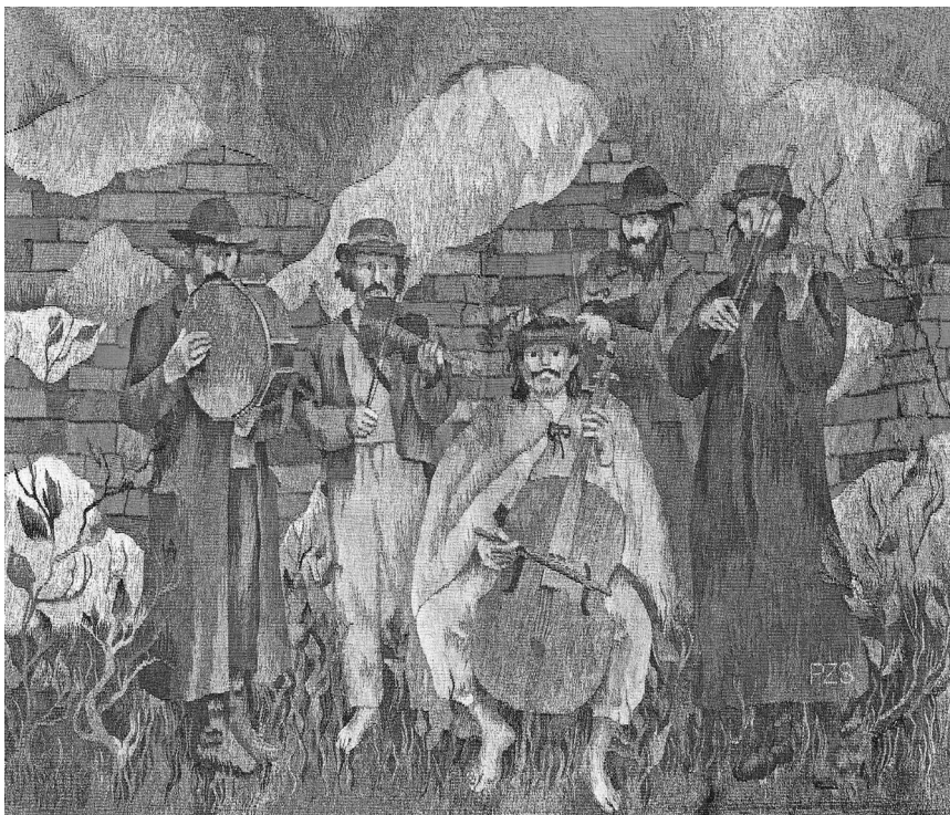
Visszajöttek a zenészek (falikárpit)

– Ne aggódjon, megoldjuk. – Mindenhol ezt mondták... én eltévedtem. Jártam laborokban, gyomortükrözésen, specialistáknál, de most egészen biztos, hogy nem jó helyre jöttem.