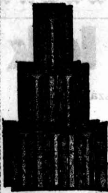
Nagykikindai gyártmány. Bohn-féle szab. biztonsági át- fedő cserép 272 sz.

Képes árjegyzék és minták kívánatra ingyen és bérmentve.