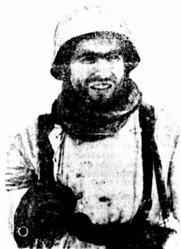
Német harcos a keleti fronton. (RDV.)

Baktériumok a Szaharában. A Buvár januári száma írja. — Első hallásra egészen életellenesnek gondolnók a sivatag homokjait, pedig nem így van. Nemrég vizsgálták meg a kutatók a saharai sivatagból származó homokmintákat és azt a meglepő eredményt tartalmazza beszámolójuk, hogy egyáltalán nem lehet szó a sivatagi talajok élettani hatálatlanságáról és csirátlanságáról. A vizsgálatkor kiderült ugyanis, hogy nem kevesebb, mint kilencvennyolcféle baktérium, harmincnyolcféle alsóbrendű gomba és nyolcvannegyféle algája rejtőzik a napsütötte sivatag sárgás homoktalajában. Tekintélyes számban szerepeltek ezek között a növények számára fontos tápanyagokat készítő nitrifikáló és nitrogént oxidáló mikroorganizmusok.