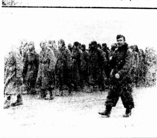
Na potu v zaroblenički lager.

Najnoviši glas nam veli, da v ishodnim Alpam v debelim snegu se moči prek sto američkih pilotov, šteri su se z gorečih avionov doli pustili i veter njih je odnesel na te gore, štere su 3—4000 meter visoke i zima 20—30 gradušov Puščaju v noči gori čelene rakete i prosiju pomoč. 114 pilotov je do ve dalo glasa za pomoč, eli sigurno bodo poginuli, kajti nemške patrole, štere su njim poslali na pomoč, v velkom snegu