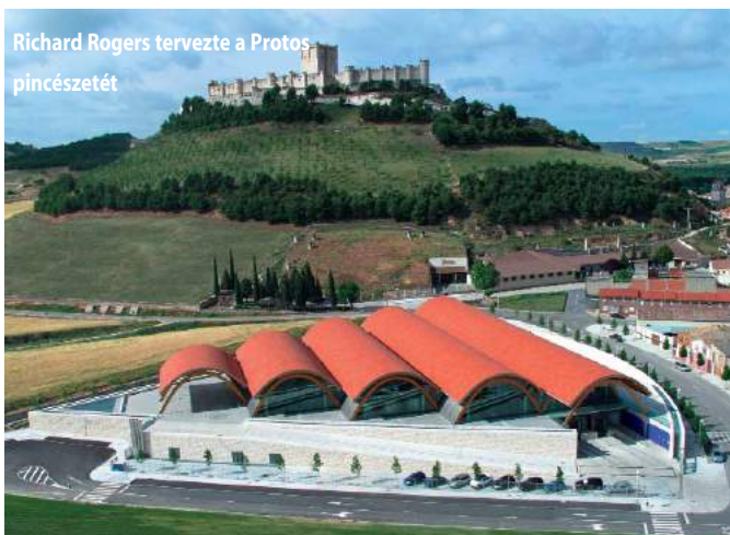
Richard Rogers tervezte a Protos pincészetét