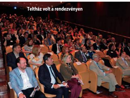
Teltház volt a rendezvényen

Mi a közös a spanyol Marqués de Riscal, a Portia és a Protos pincészetek között? Amellett, hogy Spanyolország legjobb és legismertebb bortermelői, az utóbbi években az is erősítette a hírnevüket, hogy egyedülálló, figyelemfelhívó és emblematikus borászati épületeik és pincéik révén ötvözték az építészeti innovációt a bor világváral: Frank O. Gehry,