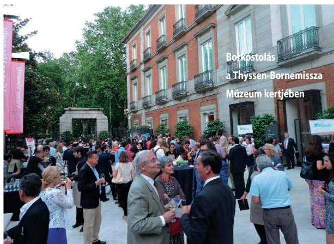
Borkóstolás a Thyssen-Bornemisza Múzeum kertjében