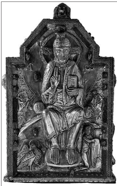
1. kép. Szent Móric ereklyetartója, 1100 körül (Apátsági kincstár, Saint Maurice d'Agaune)

A valószínűleg 534 után íródott Vita abbatis Agaunensis már úgy beszél Móricról és társairól, mint akik az oltár belsejében várják a feltámadást, fölöttük a szerzetesek kórusának örök dicsérete olyan, mint az angyalok kórusa. Ennek a hierarchiának olyan politikai töltete volt, ami komoly nehézségeket okozott az apátságnak azt követően, hogy Zsigmond burgund királyt 524-ben Chlodomir frank uralkodó meggyilkoltatta. 534-ben, amikor a frankok elfoglalták és felosztották a Burgund Királyságot, a thébaiak tisztelete mellett az apátságalapító Zsigmond burgund király kultusza is megjelent. A Szent Móric-apátság nemcsak a vértanú legionáriusok, hanem Szent Zsigmond király tiszteletének is központja lett, ami óriási befolyást és hatalmas vagyont biztosított a kolostornak. Frederick S. Paxton Szent Zsigmond csodatévő erejét és liturgiáját mutatja be válogatásunkban. A 6–9. század folyamán káprázatos liturgikus tárgyak áramlottak az apátságba, olyan páratlan kincsek, mint „Szent Márton vázája”, Teuderik kámeákkal és véssett drágakövekkel ékes ereklyeládája (2–3. kép), vagy Nagy Károly kancsója. 20