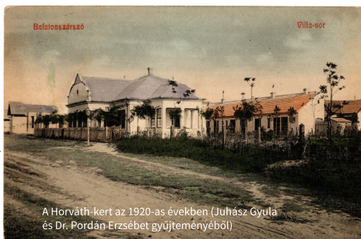
A Horváth-kert az 1920-as években

Utolsó tartózkodási helyén, a balatonszárszói vasútállomástól kőhajításnyira fekvő Horváth villában rendezték be a József Attila Emlékmúzeumot, ahol nemcsak a névadó életének fontos stációival, hanem gondolkodói-művészi hagyatékával is szembesülhetnek a látogatók. S hiába telt el csaknem nyolc évtized a szárszói tragédia óta, ez a szellemőrző épület a Balaton-vidék egyik leglátogatottabb kulturális zárandókhelye.