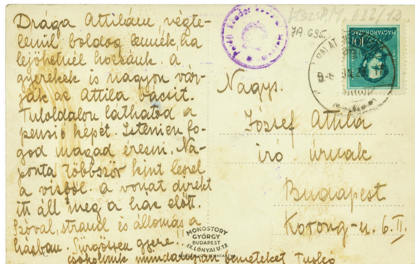
József Etelka levele József Attilának, Balatonszárszó, 1936. jún. 23. (PIM Művészeti Tár)

Sok mindent elárulnak érzelmi állapo- táról ekkori versei. A vízparti merengés során föltámadtak korábbi természetél- ményei, s mint gyakorló lélekelemző,