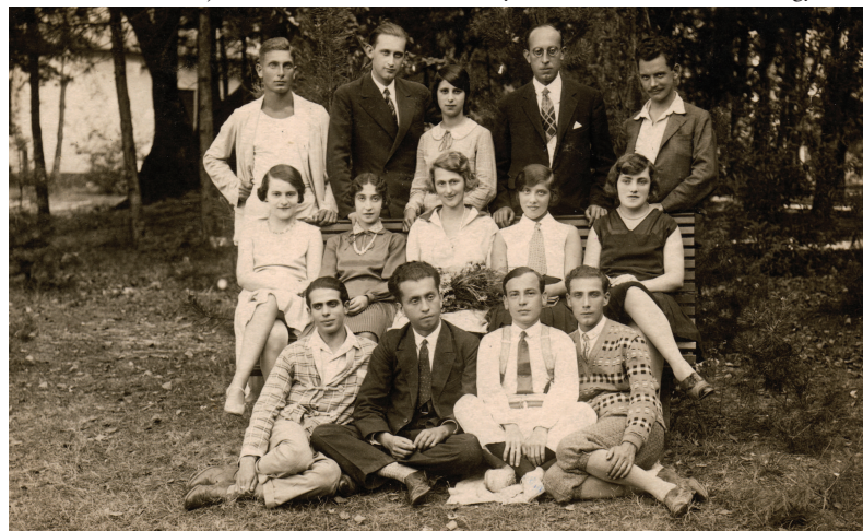
József Attila a MÁBI-szanatóriumban Tóth Ferencsel és más beutaltakkal, Balatonlelle, 1929. október 10. (PIM Művészeti Tár)

Örömmel fogadta sógora tervét is, mely a harmincas évek közepétől család- jukat Balatonszárszóhoz kötötte. Makai Ödön ugyanis betársult az ottani Palota Panzió fenntartásába, s neki is szerepet szánt a „projekt”-ben: „Ödön feltétlenül szükségesnek tartja, hogy én is lemenjek, mert Etus és a gyerekek meg azok kisasz- szonya, aki német, mellett kell egy férfi,