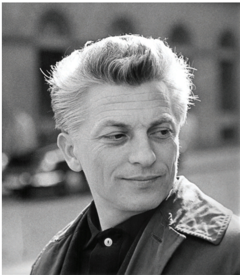
Utcán, 1960-as évek eleje (Magántulajdon)

A technika-kritika vonatkozásában leginkább hangsúlyos Búcsúzik a lovacska szintetizáló igényű vers, melyben a költő az emberiség jövőjének vízióját alkotja meg a technikai civilizáció egyre nagyobb mértékben érvényre jutó folyamatainak és tendenciáinak fényében. A lírai én a valóság egészével történő számvetésekor szembesül azzal a ténnyel, hogy a gépi civilizáció előretörése és a modern technológia térhódítása súlyosan veszélyezteteti a klasszikus humanista értékeket. Az emberi létmód alapját jelentő szilárd, önértékekkel bíró formák és szabályok szétzúzódnak, felaprózódnak. E jelenség a költő életének keretét biztosító történelmi és társadalmi korszak