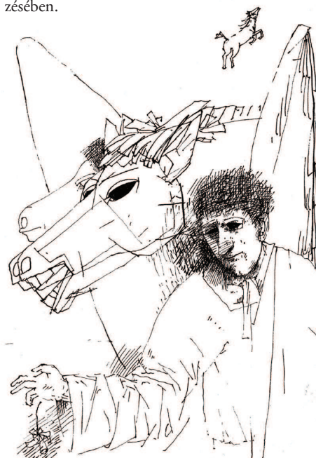
Kondor Béla illusztrációja Nagy László Búcsúzik a lovacska című verséhez (Nagy László: Arccal a tengernek. Versek, 1944–1965 , Szépirodalmi, 1966)

A kiindulópontként rögzített problémát a hivatkozott versek alapján megvilágító elemzések eredménye az a végkövetkeztetés, hogy Nagy László költői munkásságának érett korszaka az ember és a világ viszonyára vonatkozóan komplex, a szűk értelemben vett irodalmi kontextuson túlmutató jelentéstartalmakat hordoz. Ily módon fontos szerep illeti meg a posztmodern világállapot szüntelenül változó, bonyolult valóságának értelmezésében.