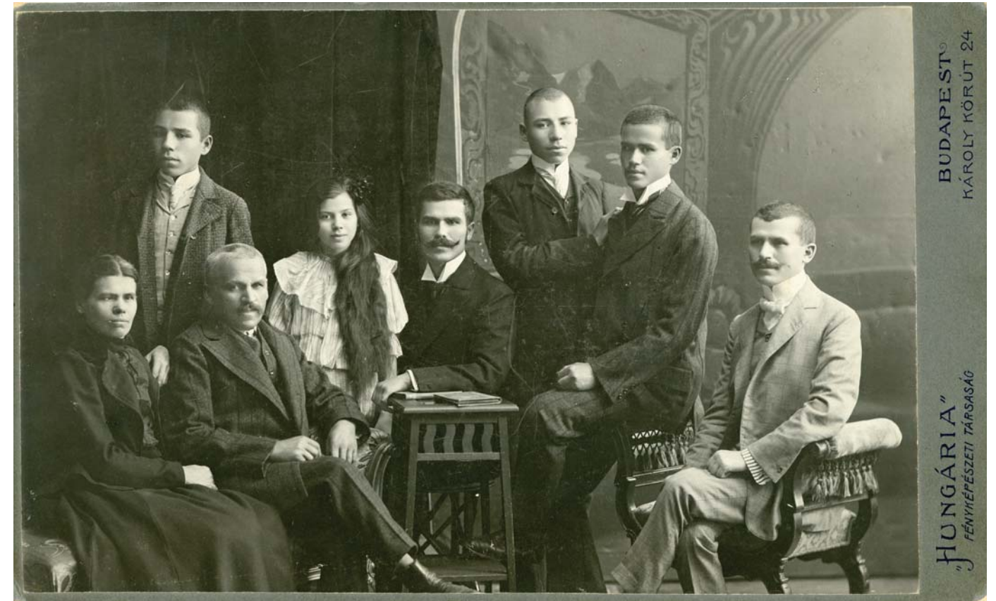
Móricz Bálint és családja, a gyermekek közül hiányzik Zsigmond, 1906

takozó szabadversenyos kapitalizmus, amelynek kiteljesedése a társadalmi osztálykülönbségek nagymértékű növekedését eredményezte. Ebben az időszakban az európai gazdaság hagyományos – a középkorból származó – keretei végérvényesen eltűntek, és létrejöttek a modern urbanizált társadalom alapjai, melynek centrumai az ipari termelés „fellegvárait” jelentő nagyvárosi térségek. E változások jelentősen csökkenték a városiasodásból kimaradt, elszigetelt vidéki térségek fejlődési esélyeit, mivel azok lényegi megélhetési forrása a mezőgazdaság volt. Ennek következtében fokozatosan háttérbe szorult az itt élő emberek gazdasági tevékenysége és társadalmi szerepe is.