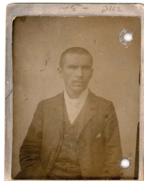
Móricz Zsigmond ifjúkorában

A regényben a társadalmi mobilitás problémaköre az életrajzi események regényszerű elbeszélésének legfőbb vezérfonalát képezi. A szereplők (különösen az író édesapja, Móricz Bálint, akit rendkívüli kezdeményező-készsége, bátorsága és állhatatossága emelnek ki végérvényesen a falu világából) döntéseinek, tetteinek lényegi mozgatórugói, sorsfordulatainak valódi okai csak akkor érthetők meg, ha azokat a késő Monarchia-korabeli (és az I. világháború utáni) Magyarország társadalmi rétegzettségének és gazdasági folyamatainak fényében vesszük szemügyre. Ezek közvetlenül összefüggnek a településformák közötti különbségekkel – konkrétan: a települések hierarchiájával. A regényben bemutatott folyamatok általános gazdasági háttere pedig nem más, mint a modern ipari forradalom nyomán kibon-