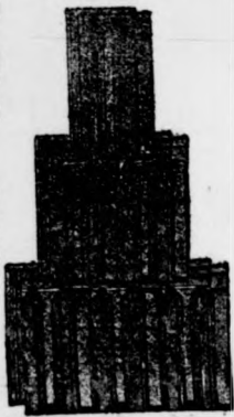
Nagykikindai gyártmány. Bohn-féle szab. biztonsági átfedőcserep 272. sz.

Képes árjegyzék és minták kívánatra ingyen és bérmentve.