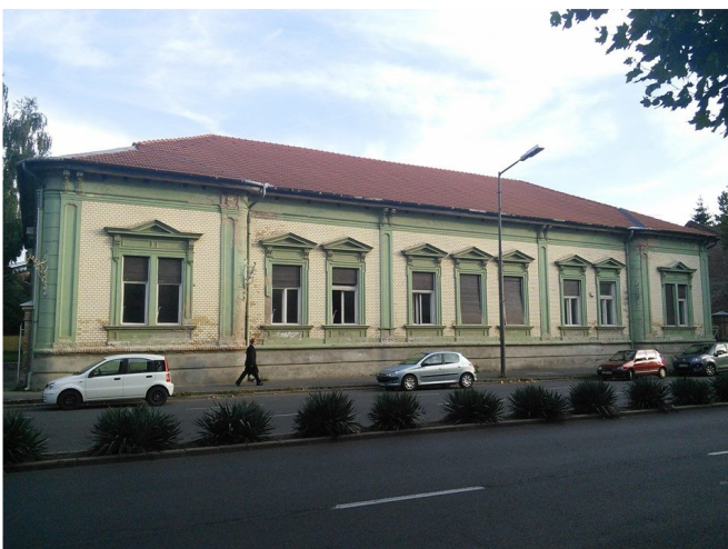
Új Nemzedék Közösségi Tér az Andrassy úton