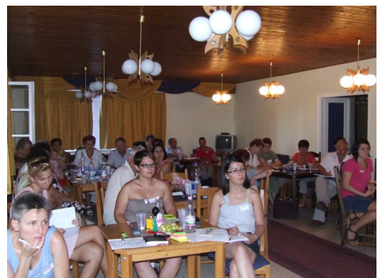
Pillanatkép a tavalyi bentlakásos képzésről