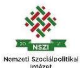
20 NSZI Nemzeti Szociálpolitikai Intézet

A program keretében vállalt szolgáltatásokat a Béthel Alapítvány folyamatosan biztosítja, melynek eredményeként már hat fő megváltozott munkaképességű álláskereső tudott a nyílt munkaerőpiacon elhelyezkedni.