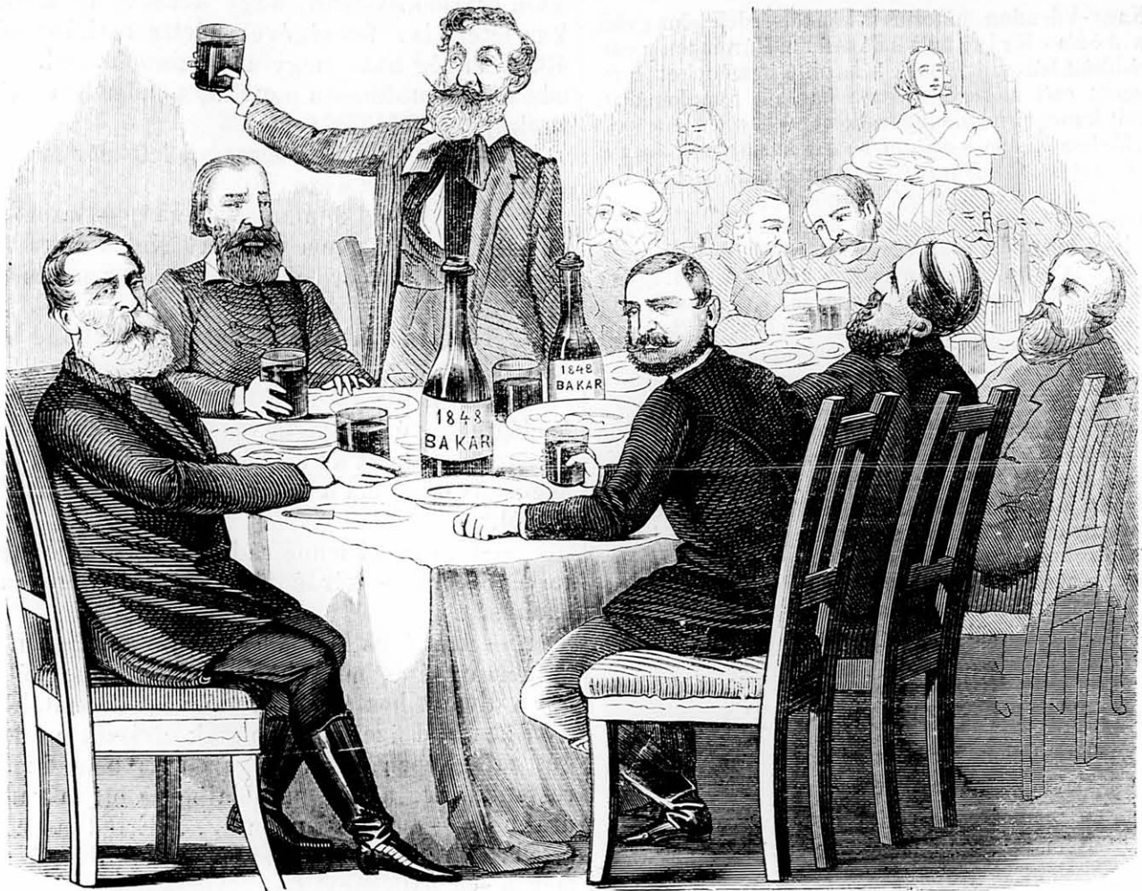
Az ilyen hátultöltő puska által biztosított béke eredménye.