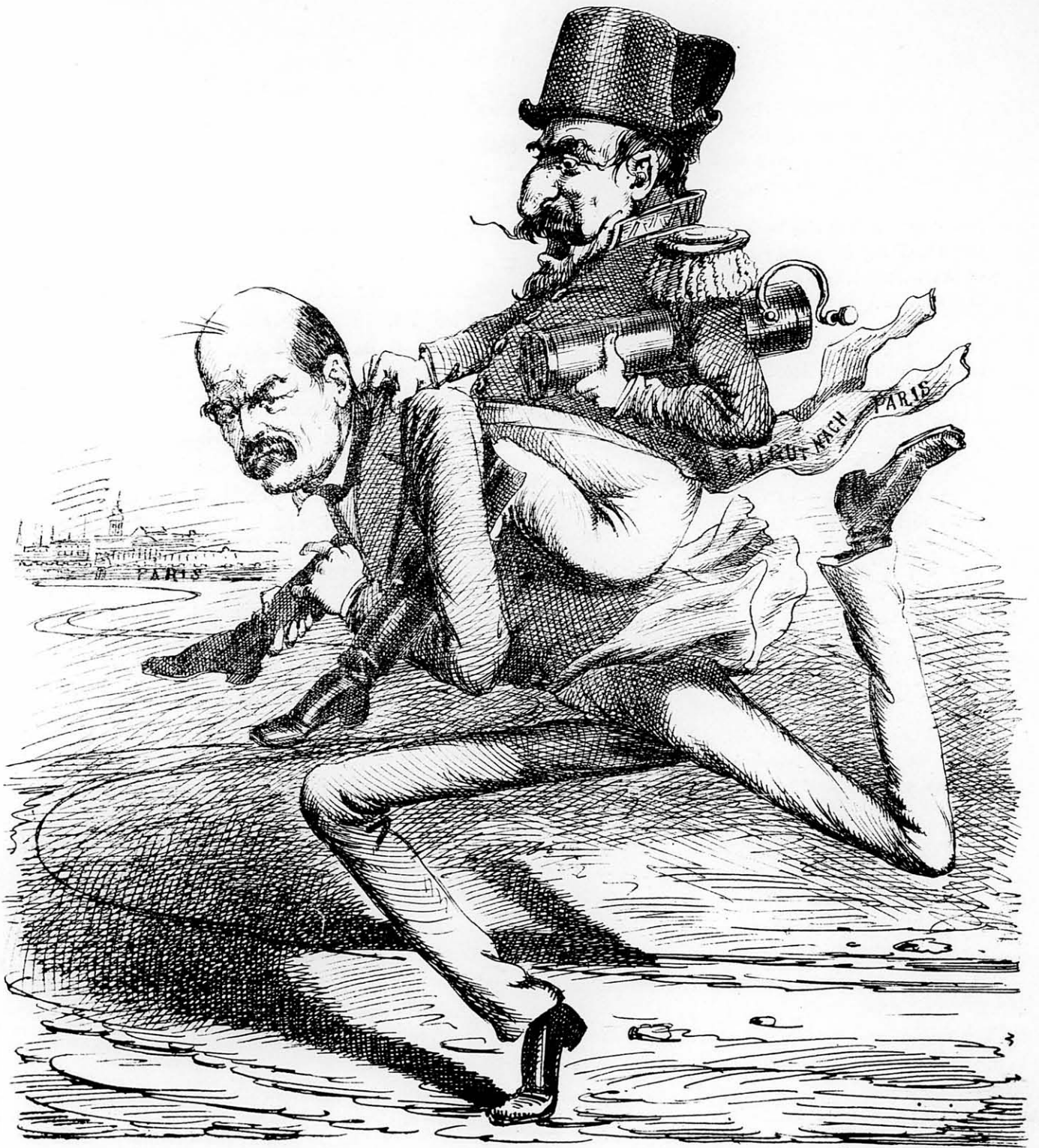
Napoleon: Sapperlöt! burkust fogtam, de viz.