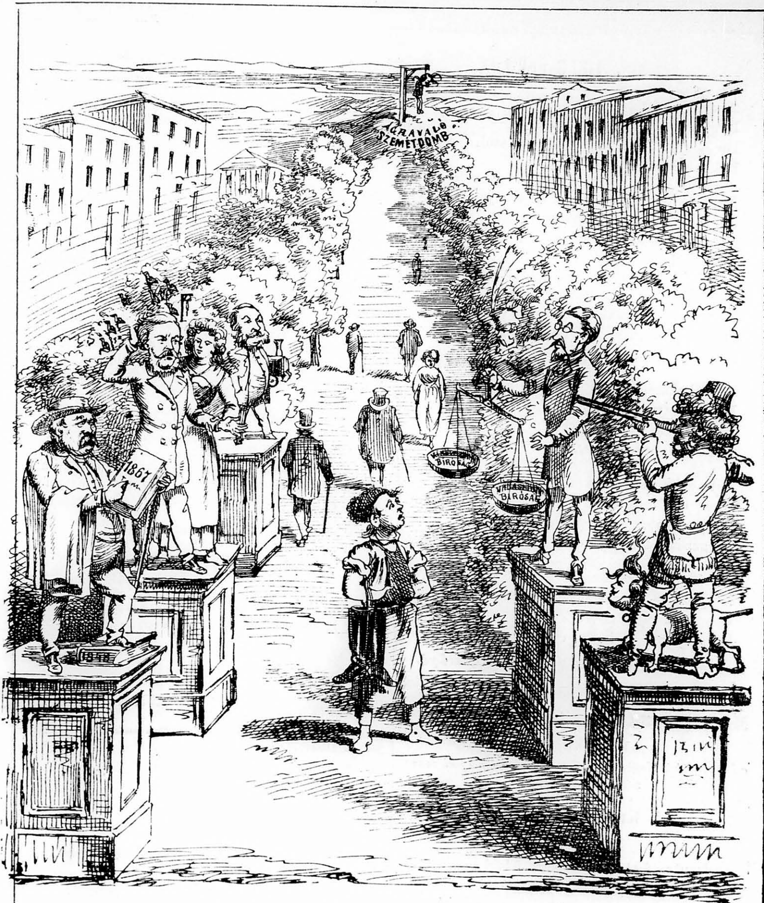
Kinek hova kell emlékszobrot állítani? (a sugárut építő bizottságnak ajánlja Ludas Matyi.)