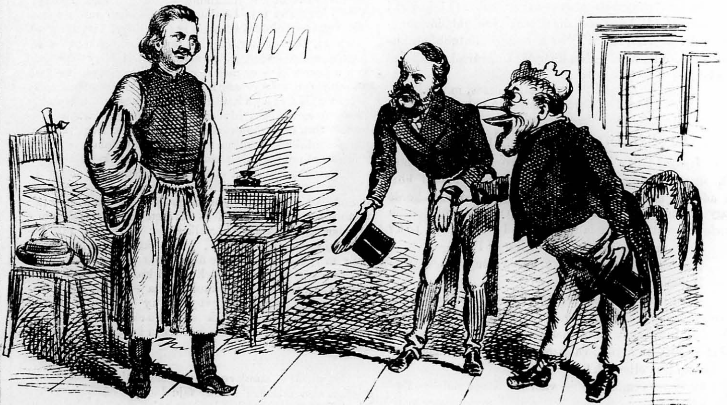
„Kikiriki“ kolléga pedig, hogy a kölcsönt vissza adja, Lónyay miniszterelnökségét ajánlja a Matyi kegyébe.