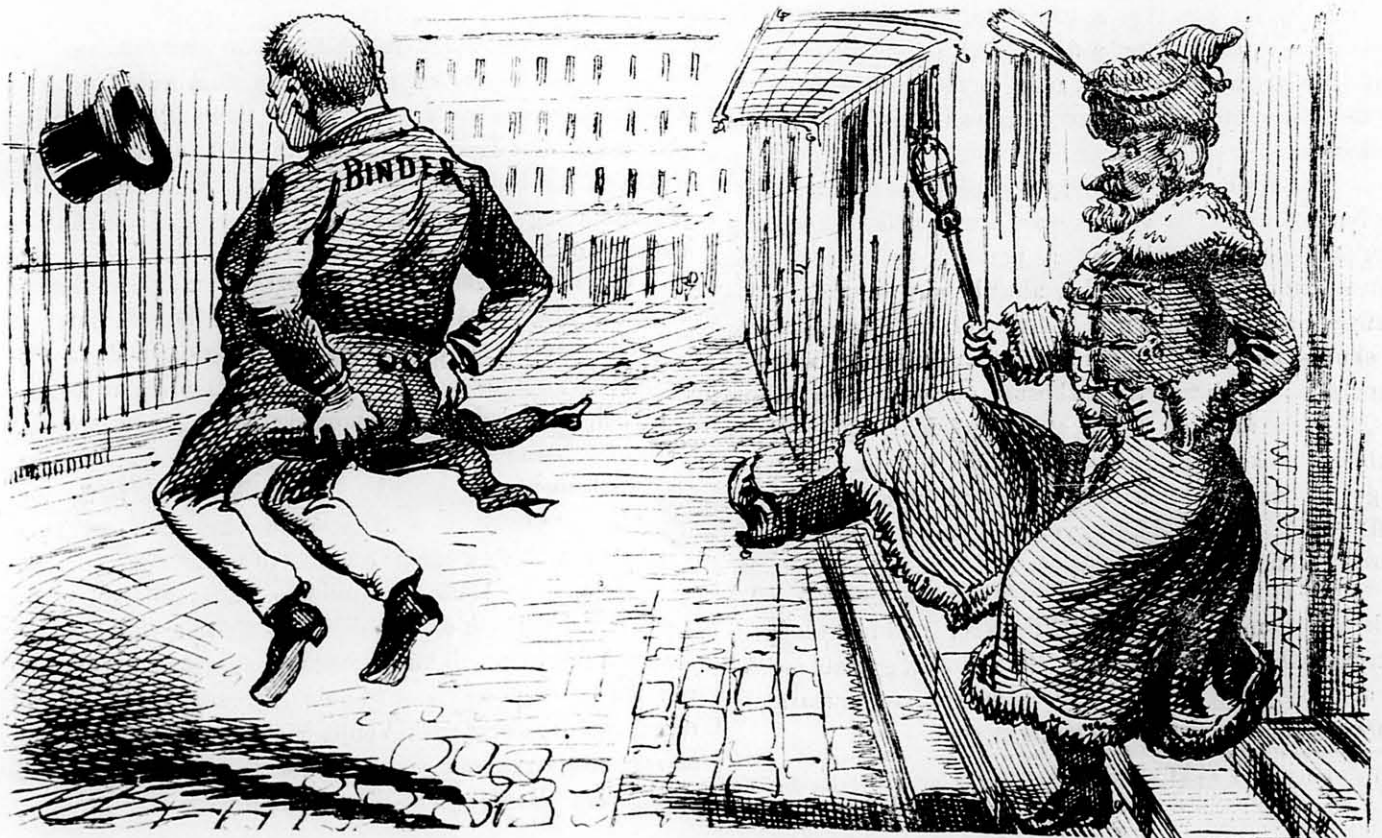
Binder urnak képviselői diurnumaira ráadásul még ez is dukálna.