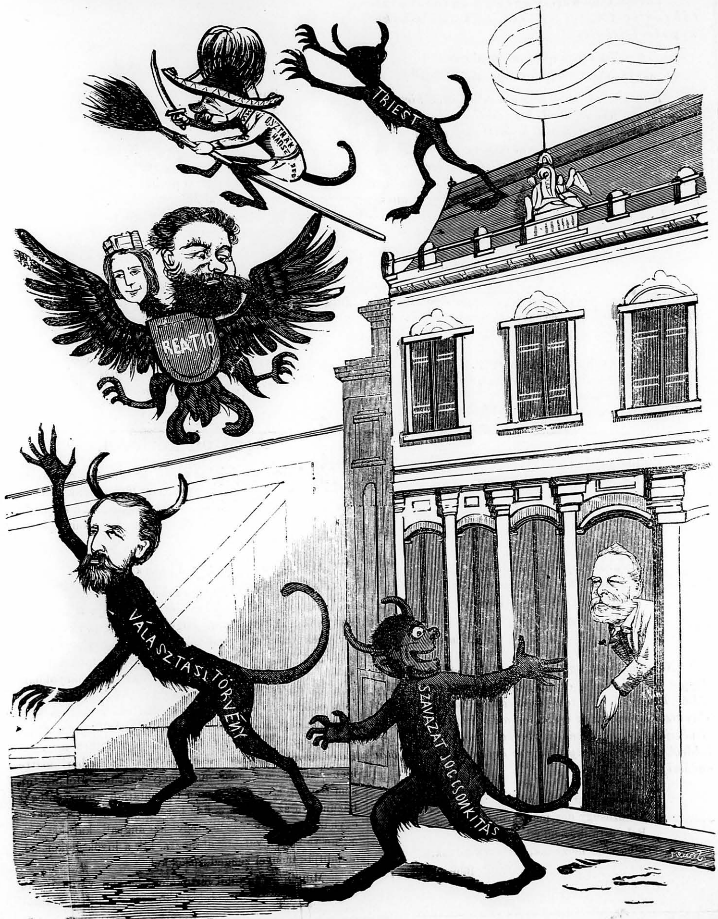
És ime a kormány az ördögöket támasztotta fel.