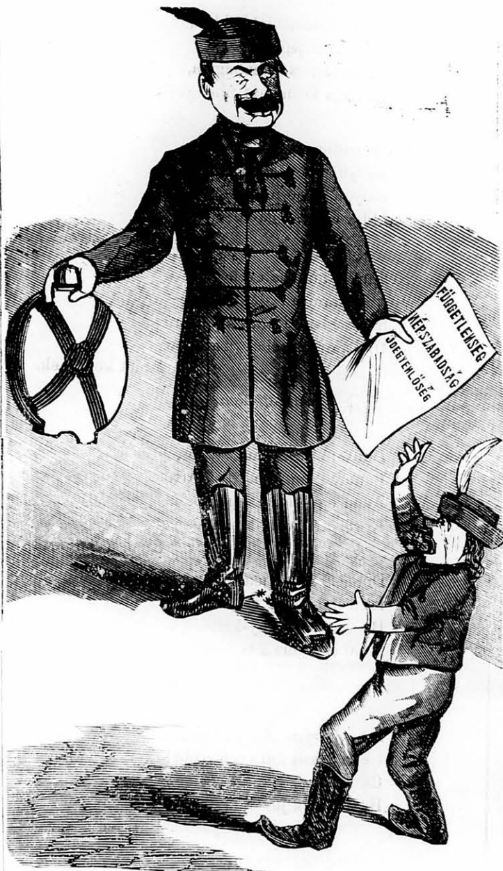
Választás előtt ígér mindent.