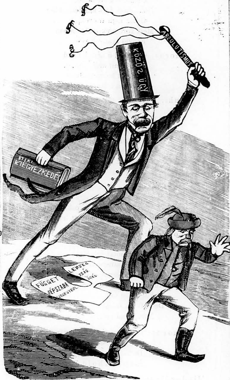
Ha megválasztatott így tartja meg ígéretét.