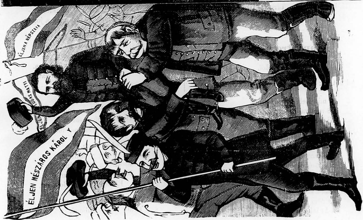
a vidéki körútjában.