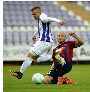
Az Újpest és a Videoton döntetlenre végzett