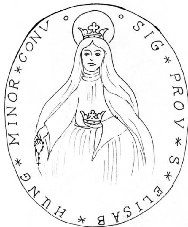
2. b. kép

c.) 1876. Ovális viaszpecsét. 30×25 mm. A pecsétképen Szent Erzsébet félalakos ábrázolása jelenik meg, ruháját palást borítja, jobbra hajtott fején korona. Jobb kezében (olajfa)ágot, behajlított bal kezében könyvet (Szentírást) tart. 21