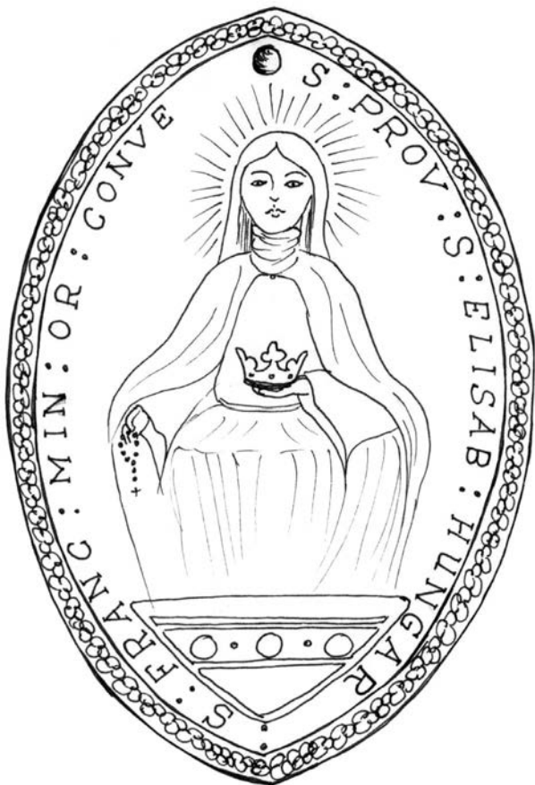
1. b. kép

A pecsét körirata: S(IGILLUM) PROV(INCIAE) S(ANC-TAE) ELISAB(ETHAE) HUNG(ARIAE) S(ANCTI) FRAN-C(ISCI) MIN(ORITARUM) OR(DINIS) CONVE(NTUALIUM).