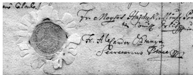
2. a. kép

A pecsét körirata: SIG(ILLUM) PROV(INCIAE) S(ANC-TAE) ELISAB(ETHAE) HUNG(ARIAE) MINOR(ITA-RUM) CONV(ENTUALIUM).