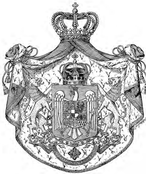
2. kép. A Román Királyság 1921-es nagycímere J. Sebestyén de Keöpecz aláírással. Megjelent az Univercul című napilap (39. évf. [1921. júl. 29.] 169. sz.) címlapján (A könyv nem közli)

De nemcsak hiányról, hanem többletről is beszámolhatunk. Megjelent munkái felsorolásnál az 1920-as évszám alatt három címet találunk: A román államcímer (Közölve Sas