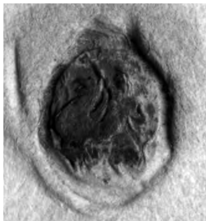
1. kép. Szapolyai János pecsétje (DL 82472.)

Közismert, hogy középkori királyainktól nem maradtak fenn saját kézzel írott, összefüggő szövegelemlek. Uralkodóink latin nyelvtudásáról természetesen nem árul el sokat aláírásuk, amelyek I. Ulászlótól (1440–1444) kezdődően ismertek, de amelyekkel tömegesen először II. Ulászló (1490–1516) oklevelein találkozunk. Utóbbi királyról ráadásul nem csak azt tudjuk, hogy jól beszélt latinul, de két saját kezű oklevélzáradékot is ismerünk tőle. 2 Mindaddig János királytól (Szapolyai Jánostól) is csak aláírásait ismertük: 1505 és 1526 között 12 iraton áll saját kezű aláírása, további öt oklevélről