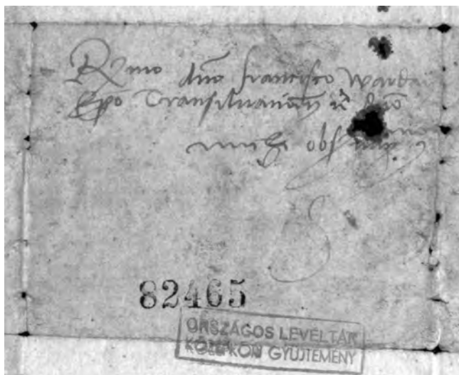
2. kép. (DL 82465. külzet)