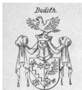
6. kép – A boroszlói Dudich András-kép címere (Siebmacher, V. 3. 25. tábla)