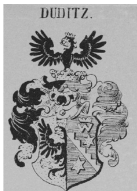
4. kép – A morvaországi Dudich András-címer (Siebmacher, IV. 10. 141. tábla)

csillag között, a felső csillag felett ezüst W betű, tetején arany korona. Sisakdísz: koronából kinövő sas, sisaktakaró: fekete-arany és kék-ezüst. 14