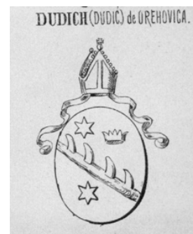
5. kép – Dudich András pécsi püspök címere (Siebmacher, IV. 13. 159. tábla)

Dudich Andrásnak a boroszlói Erzsébet Könyvtárban őrzött arcképén szerepel az a címer, amelyet lemásoltak a kétezer polgári címer összeállításához. A címer leírása: hasított pajzs, első mezőjében fogazott harántpólya, két csillag által kísértén; a jobb felső sarokban ferde W. A második mezőben fél sas a hasadéokban. Koronás sisak, felszállni készülő galamb. 16