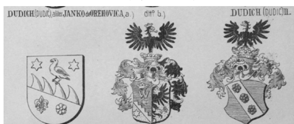
3. kép – A horvát-szlavón Dudichok címerei (Siebmacher, IV. 13. 31. tábla)