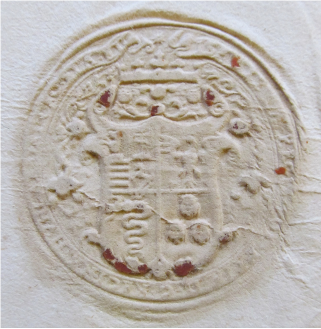
1. kép – ld. 1. sz. levél

mulasztja el nyomatékositani, hogy rokonként ( consanguineo ) ír a számára.