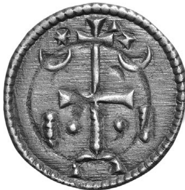
8. kép – 12. századi érem, előlap (Huszár 116.)

században mi volt az apostoli kereszt küldésének a jelentősége? Mit értettek az egyházban apostoli keresztnek? Milyen volt a formája? És a pápa keresztküldésén mit értett (vagy értett félre) Hartvik és Kálmán, illetve a királyi udvar? Véleményem szerint szükségtelen feltételezni, hogy a legenda 9. fejezete teljes egészében Hartvik aktuálpolitikai koholmánya: csak „az egyházaknak és népeknek mindként törvény alapján történő igazgatása” 117 lehet az ő értelmezése és beszúrása. Ezt a szövegrészt III. Ince rendelkezése természetesen kihagyta az ünnepi szolozsma szövegéből. 118 A korona 119 és a kereszt küldése az apostoli levél mellett tárgyyszerű és hiteles lehet. 120 Mindenesetre a pápától érkezett keresztnek a magyar udvarban kezdettől nagy jelentőséget tulajdonítottak, ha I. András sírkövén kifaragták, majd Salamontól kezdve az érmek hátlapjára folyamatosan ráverték. Az éremhátlap ábrázolása egyértelműen arra mutat, hogy a korábbi lancea regis -t a körmeneti kereszt váltotta fel. Aligha tételezhető fel, hogy a változás nem szándék nélkül történt. Az ábrázolások tanúsága szerint ez a kereszt kétségtelenül latin kereszt volt. A 12. század vége felé pedig gyakorlatiasan gondolkodtak: a jelvényt fontosnak tartották, és ezért kettős keresztté átalakítva az ország címereként megtartották, hogy ne lehessen összetevésztetni a keresztiesek jelével.