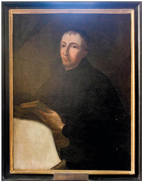
1. kép – Berzeviczy Valériánt ábrázoló festmény, jelenleg a váci piarista rendházban (Borbás Péter felvétele, Piarista Múzeum)

Valérián a magyarhoz csatlakozott. Privigyén hunyt el 1707-ben. 8 Berzeviczy Sándor/Valériánnak fennmaradt egy portréja, feltehetőleg Privigyén készült 1700 körül, jelenleg a váci piarista rendházban található, festője ismeretlen. 9