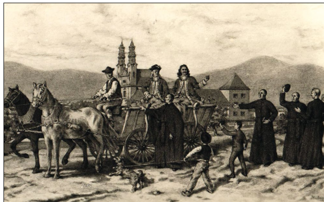
2. kép – II. Rákóczi Ferenc és Berzeviczy Ádám pihenője a piaristák között menekülés közben, búcsú pillanata Schrade Bernáttal. Képeslap 1942-ből 26

A fent leírtakon kívül még egyszer került a szabadságharc idején olyan helyzetbe, hogy Rákóczi életének megmentéséhez hozzájáruljon, mégpedig az 1708. augusztus 3-i trencsényi csatában. A csata során a fejedelem lova megbotlott, felbukott és maga alá temette urát, aki eszméletét veszítette. Odasiető hívei miután magához térítették, „...Berzeviczy Ádám istálló-mesternek Bambutius nevű szürke lovára ültették, ugyanarra a paripára, amelyen bécsújhelyi fogságából kiszabadulva menekült...” 27 Így tudták a csata forgatagából kimenekíteni.