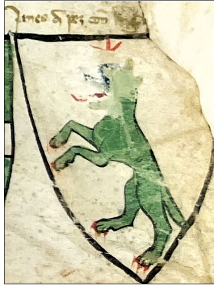
1-2. kép – „Janes de Pez” címere