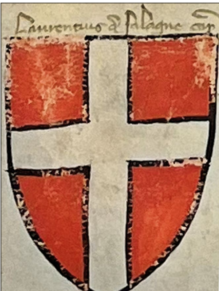
16. kép – „Laurentius de Salagne” címere