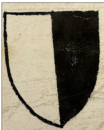
7. kép – „Michael de Erdei” címere