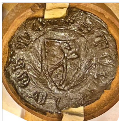
23. kép – „Lucas de Sarchis” pecsétje