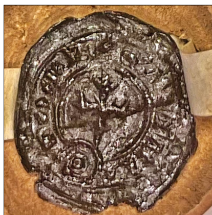
13. kép – „Petrus de Ardel” pecsétje