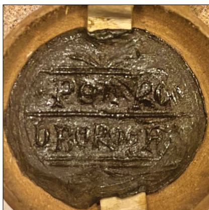
9. kép – „Petrus de Grande” pecsétje