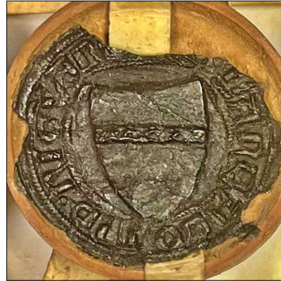
15. kép – „Lanzalotus de Niguani” pecsétje