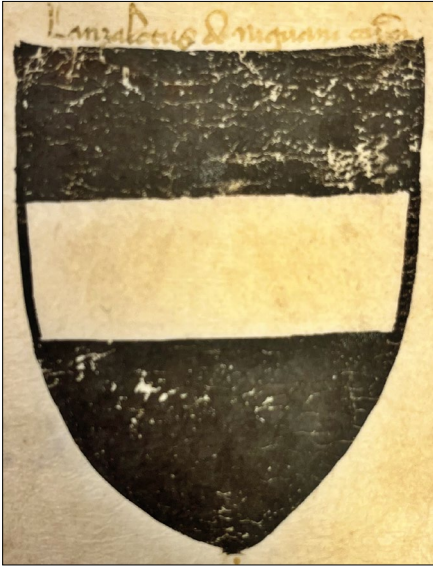
14. kép – „Lanzalotus de Niguani” címere