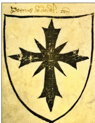
12. kép – „Petrus de Ardel” címere