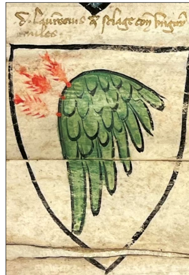
3-4. kép – „Dominus Laurentius de Selage” címere