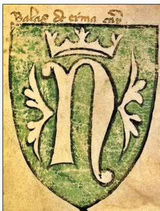
20. kép – „Balas de Erma” címere