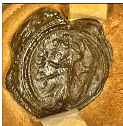
25. kép – „Johannes de Strega” pecsétje