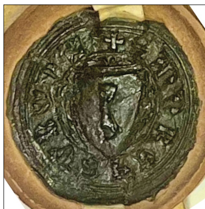
11. kép – „Andreasius de Buday” pecsétje