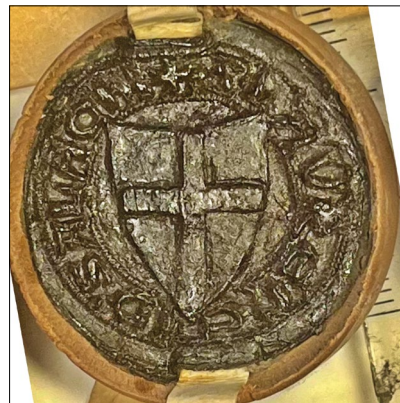
17. kép – „Laurentius de Salagne” pecsétje