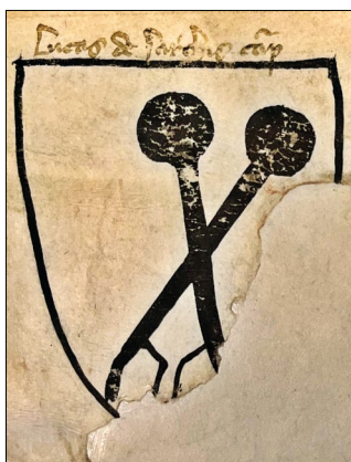
22. kép – „Lucas de Sarchis” címere