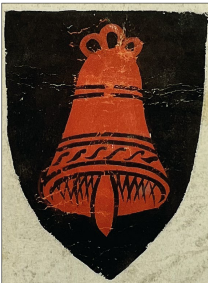
5. kép – „Gregorius de Tona” címere