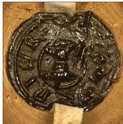
6. kép – „Gregorius de Tona” pecsétje