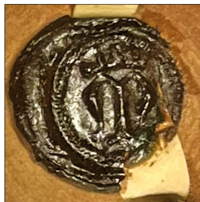
19. kép – „Johannes de Ezdenz” pecsétje