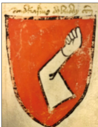
10. kép – „Andreasius de Buday” címere