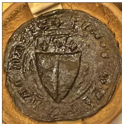
8. kép – „Michael de Erdei” pecsétje