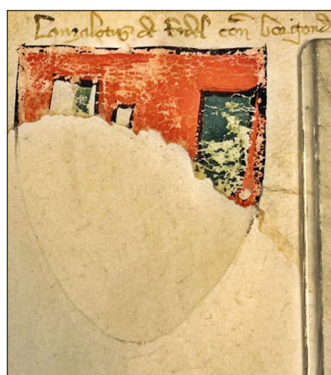
26. kép – „Lancalottus de Ardel” címere