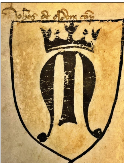
18. kép – „Johannes de Ezdenz” címere