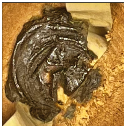
21. kép – „Balas de Erma” pecsétje