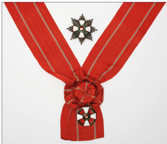
9. kép – A Magyar Köztársasági Érdemrend babérággal ékesített nagykeresztje. (Magyar Nemzeti Múzeum, Dinnyés Lajos hagyatékából)

középkeresztet a csillaggal. 13 1948 január folyamán két ízben román politikusokat és katonákat tüntettek ki. A román vezérkar főnöke, Constantin Jonascu és a munkaügyi miniszter, Lotar Radaceanu nagykeresztet kapott, míg hatan a középkeresztet a csillaggal, más alacsonyabb beosztású személyek középkeresztet és tiszti keresztet kaptak. 14