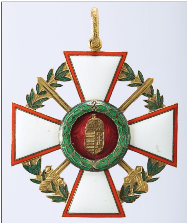
2. kép – Babérágas és kardos prototípus a második világháború utáni új kitüntetéshez (HM Hadtörténeti Intézet és Múzeum)

viszont a babérágak teljesen körbefogják a kereszt szárait, a hátlapján azonban nincs évszám. (2. kép)