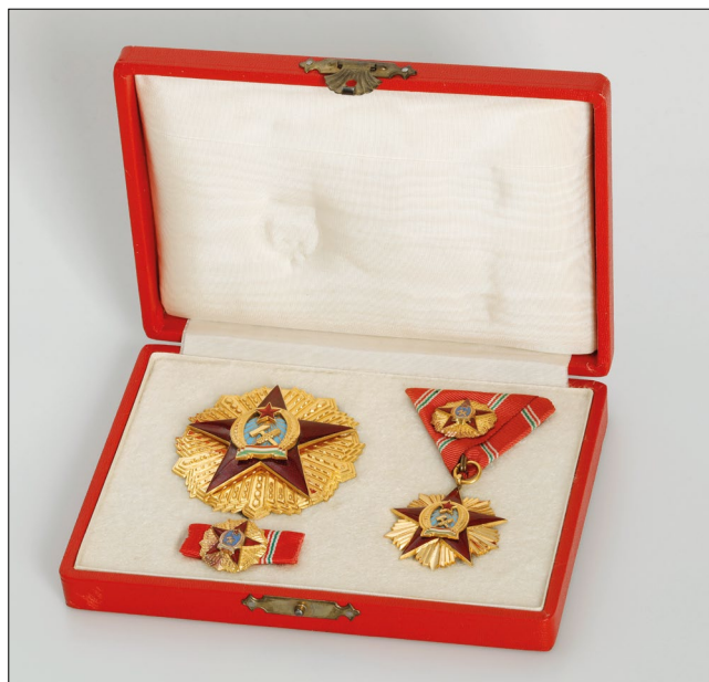
11. kép – A Magyar Népköztársasági Érdemrend I. fokozata dobozában a kisdíszítménnyel és a szalagsávval (Magyar Nemzeti Múzeum)

Végezetül egy csokorszalagon függő kiskeresztet mutatok be egy németországi magyar illetőségű személy magángyűjteményéből. A saját gyártású szalagot valószínűleg egy 1949 vagy 1956 után emigrált hölgy viselte, aki kitüntetettje volt ennek a fokozatnak. (15. kép)