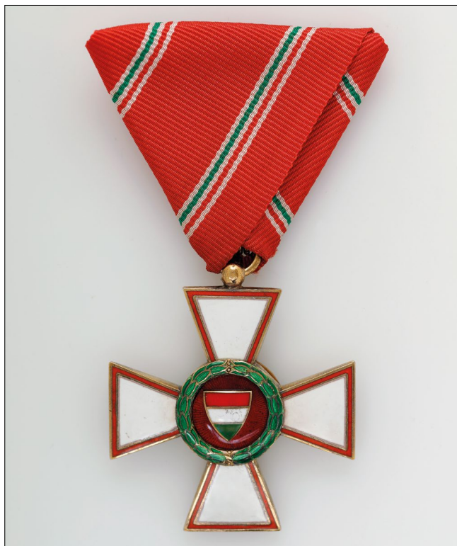
6. kép – A Magyar Köztársasági Érdemrend kiskeresztje (Magyar Nemzeti Múzeum)

a kormányfők és más hasonló állású politikusok részére adományozható babérággal ékesített nagykeresztrel. 7 (8-9. kép)