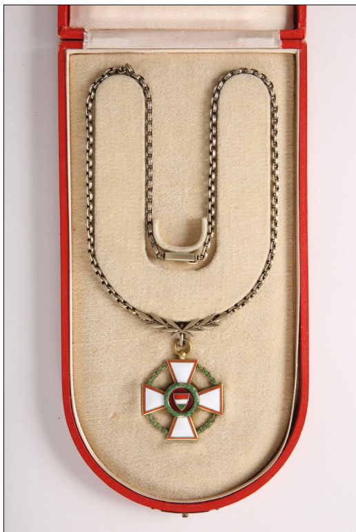
8. kép – A Magyar Köztársasági Érdemrend nagykeresztje láncon (Magyar Nemzeti Múzeum)

Mihályfi Ernőt, a köztársasági elnöki kabinetiroda főnökét Dinnyés Lajos miniszterelnök értesítette arról, hogy az államfő a középkeresztet a csillaggal adományozta részére. Augusztus 29-én pedig ugyancsak a kormányfő értesítette Rajk Lászlót a köztársasági elnök április 11-én kelt elhatározásáról, miszerint a korábban adományozott középkeresztet a csillaggal felcseréltesse a nagykereszt jelvényeivel, vagyis a nagykeresztrel és a hozzá tartozó csillaggal. 10