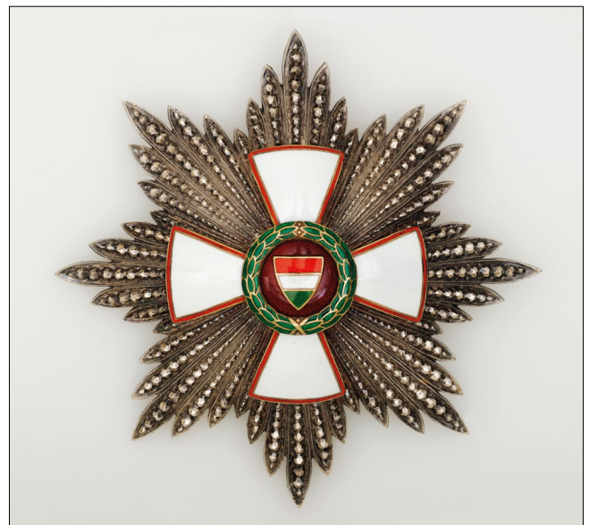
1. kép – A Köztársasági Érdemrend nagykeresztjének csillaga (Magyar Nemzeti Múzeum)

A Magyar Köztársasági Érdemrend és Érdemérem létrehozásának előzményeihez tartoznak azok a mintapéldányok, amelyeket korábban Molnár József ismertetett. 3 Azokon az