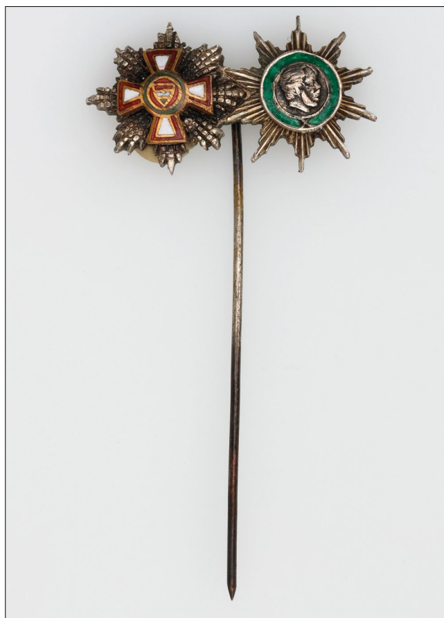
12. kép – A Magyar Köztársasági Érdemrend nagykeresztje csillagának és a Magyar Szabadság Érdemrend ezüst fokozatának miniatűr jelvénye közös tűvel. (Magyar Nemzeti Múzeum Mihályfi Ernő hagyatékából)