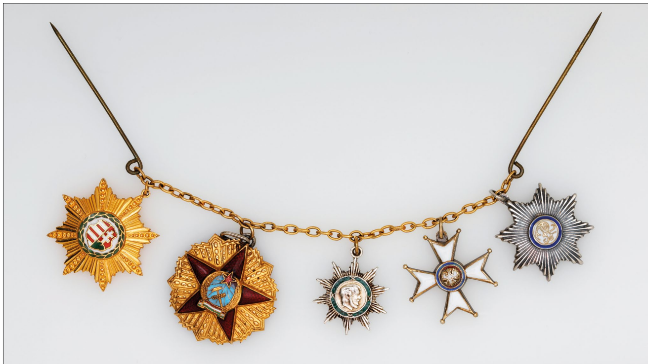
14. kép – Frakklánc a Magyar Kossuth Érdemrend I. osztályú, a Magyar Népköztársasági Érdemrend I. fokozatú, a Magyar Szabadság Érdemrend ezüst fokozatú jelvényének és a Lengyelország Újjászületése Rend I. fokozatú keresztjének és csillagának miniatűrjeivel. (Magyar Nemzeti Múzeum, Mihályfi Ernő hagyatékából)