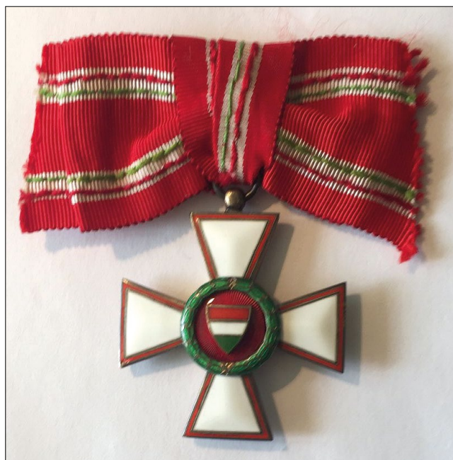
15. kép – A Magyar Köztársasági Érdemrend kiskeresztje női csokorszalagon (Magyar Nemzeti Múzeum)