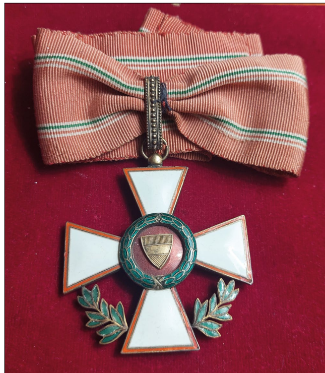
3. kép – A Magyar Köztársasági Érdemrend hadiékítményes mintapéldánya, 1945. Előlap (magángyűjtemény)