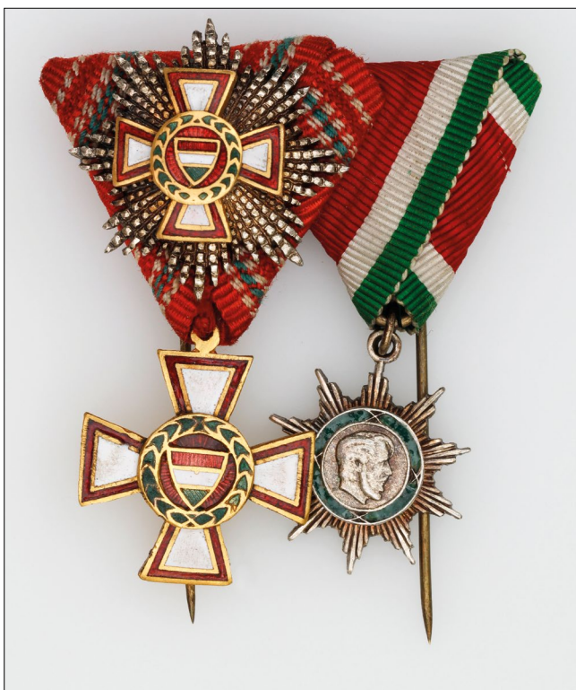
13. kép – A Magyar Köztársasági Érdemrend nagykeresztje kisdíszítményének és a Magyar Szabadság Érdemrend ezüst fokozatának miniatűr jelvénye. (Magyar Nemzeti Múzeum Mihályfi Ernő hagyatékából)