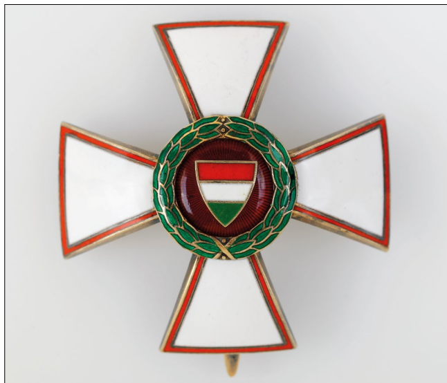
5. kép – A Magyar Köztársasági Érdemrend tisztikeresztje (Magyar Nemzeti Múzeum)