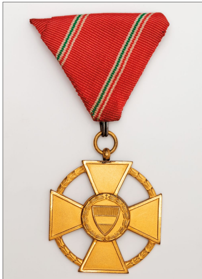
7. kép – A Magyar Köztársasági Érdemérem arany fokozata (Magyar Nemzeti Múzeum)

adományoztak. 8 Megosztásuk – két lánc, tíz babérággal ékesített nagykereszt, 121 nagykereszt, 165 középkereszt a csillaggal, 202 középkereszt, 403 tisztikereszt és 561 kiskereszt. Az érdemermekből ehhez képest jóval többet, összesen több ezer darabot adományoztak. Az 1464 érdemrendből 942 magyar, 522 külföldi megadományozott személy volt.