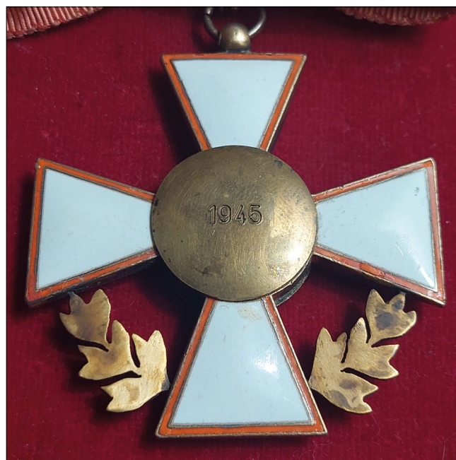
4. kép – A Magyar Köztársasági Érdemrend hadiékítményes mintapéldánya, 1945. Hátlap (magángyűjtemény)

különbséget, végül azonban egységesen csak polgári fokozatok adományozására került sor. A Magyar Köztársasági Érdemrendhez később éppúgy alapítottak egy magasabb fokozatot és láncot is, mint a Magyar Érdemrend esetében történt. Az alapszabályokat 1947. augusztus 6-án kiegészítették az államfők részére adományozható láncsal, valamint