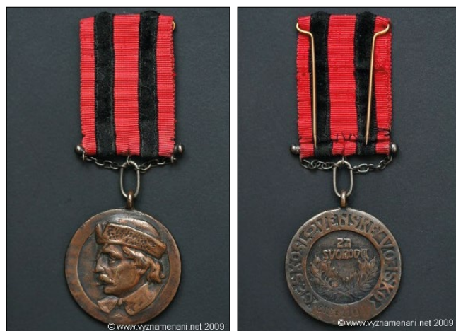
16–17. kép – Trocnói Ján Žižka Érméje (Medaila Jána Žižku z Trocnova)

Ezt a jelvényt az orosz idegenlégió alapította 1918 szeptemberében. Először 1918 decemberében adományozták a hánckai 6. lövészezred katonáinak Jekatyerinburgban. A réz jelvény Ján Žižka arcképét ábrázolja prém sapkában. A térhatást a domborműves kivitelezés mellett az biztosítja, hogy az érem szélesebb peremére kinyúlik az ing széle és a kalap. A hátlapon az érem közepén a „Szabadságért” felirat áll, hárs- és babérággal övezve. A jelvény körfelirata: „Csehszlovák hadsereg” (Československé vojsko). 26