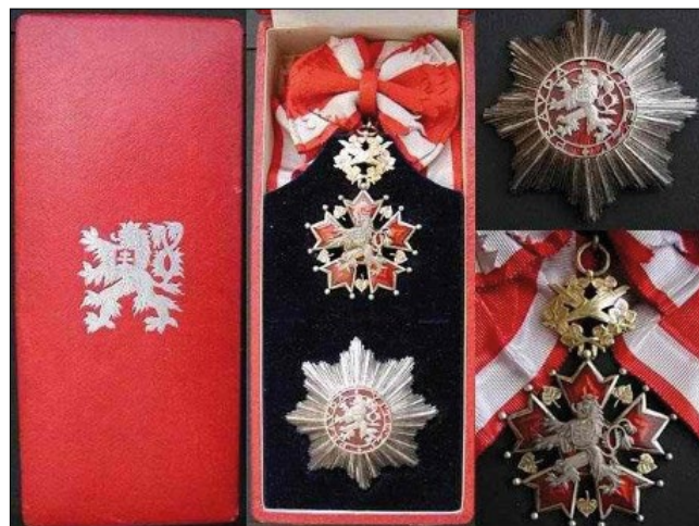
9. kép – Csehszlovák Fehér Oroszlán Érdemrend (Československý rad bíleho leva)

ágaskodó, kétfarkú, fehér oroszlánt helyezték. A hátlap szintén vörösre zománcozott, a csillag ágain Csehszlovákia régióinak (Csehország, Morvaország, Szilézia, Szlovákia és Kárpát-Ruténia) címereit helyezték el. Közepén a ČSR betűk (Československá republika, Csehszlovák Köztársaság), körülötte pedig a rend jelmondata: PRAVDA VÍTĚZÍ ('az igazság diadalmaskodik') olvasható. A szalaghoz kapcsoló gyűrű két részből állt: hármass levelekből álló koszorú, amelyet két kard keresztes és díszítés nélküli gyűrű. A kis és a nagy szalag is piros-fehér színű. Az érdemrend aranylános I. osztályú nagykeresztjét csak államfőknek adományozták, maximum 250 fő kaphatta meg. A II. osztályt főtisztek számára rendszeresítették, maximum 400 főt tüntethettek ki vele. A III. osztályt vezérkari tiszteknek adományozták, a kitüntetettek számát 900 főben maximálták. A IV. tiszti osztály érdemrendje méretében kisebb volt a II. és III. fokozathoz képest, maximum 1500 fő kaphatta meg. Az V. lovagosztály rendjele ezüstből készült, maximum 3000 főnek adományozhatták. 24