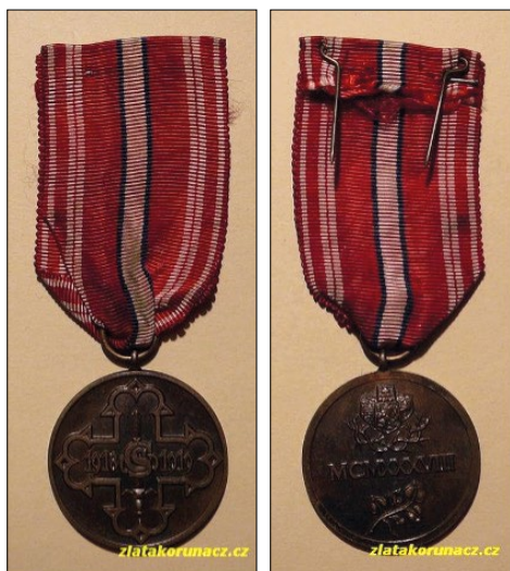
12–13. kép – Csehszlovák Önkéntesek Emlékjelvénye 1918 – 1919 (Pamätný odznak československého dobrovoľníka 1918–1919)

betűk egymásba fonódnak, a hátteret egy lovagi kard képezi. A kereszt vízszintes száraiban balra az 1918, jobbra az 1919 évszámok láthatóak. Hátlapján az érmét szinte kettéosztja a római számokkal jelzett (MCMXXXVIII) 1938. évszám felirata. Alatta egy hárság található, O.P. betűkkel. A felső részen négy kis címer áll, előtérben a cseh fehér oroszlános címer, felette részben eltakarva Szlovákia, jobbra Szilézia, balra Morvaország címerei. Az évszám és a címerek között két egy-