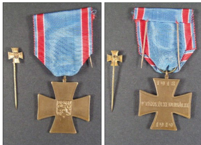
14–15. kép – „Nehéz időkben” (V ťažkých časoch) Érem

A kitüntetést olyan csehszlovák katonáknak adományozták, akik részt vettek az 1918–1919-es szlovákiai harcokban.