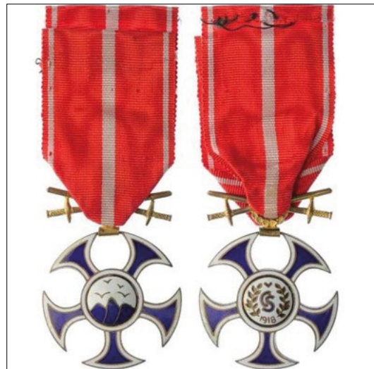
5–6. kép – Sólyom Érdemrend (Rad Sokola)

Csehszlovákia első honvédelmi minisztere, Milan Rastislav Štefánik ezredes már 1918 szeptemberében megalapítani javasolta a kitüntetést, mellyel az önálló Csehszlovákia létrejöttéért közreműködő katonák érdemeit kívánta megjutalmazni. A második legmagasabb kitüntetés volt. Az érdemrend jelvény részét tízsarkú (ötkarú) kereszt alkotja, a karok vége szélesen ívelt, melynek köszönhetően majdnem összefüggő