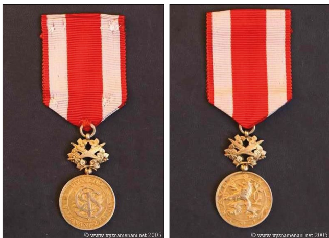
10–11. kép – Csehszlovák Fehér Oroszlán arany Érem (Československá zlatá medaila bieleho leva)

betűk egymásba fonódnak, a hátteret egy lovagi kard képezi. A kereszt vízszintes száraiban balra az 1918, jobbra az 1919 évszámok láthatóak. Hátlapján az érmét szinte kettéosztja a római számokkal jelzett (MCMXXXVIII) 1938. évszám felirata. Alatta egy hárság található, O.P. betűkkel. A felső részen négy kis címer áll, előtérben a cseh fehér oroszlános címer, felette részben eltakarva Szlovákia, jobbra Szilézia, balra Morvaország címerei. Az évszám és a címerek között két egy-