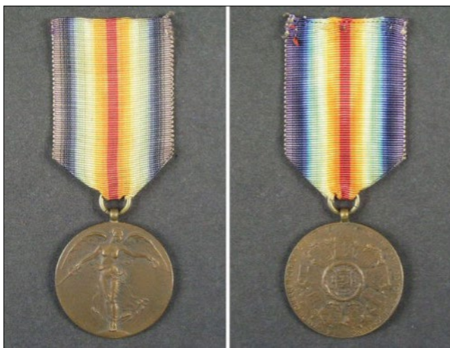
7–8. kép – Szövetségi Győzelem Érem (Spojenecká medaila Víťazstva)

Ferdinand Foch, a szövetséges seregek tábornagyának javaslatára alapították a Szövetségi Győzelem Érmét, kifejezetten a Nagy Háborúban a szövetségesek oldalán harcoló csehek és szlovákok részvételének elismeréseként. A bronzérem elülső oldalán egy női alak látható kitért szárnyakkal, mely a győ-