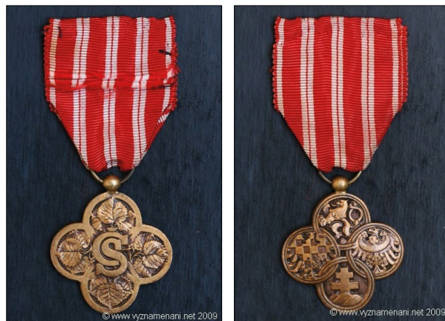
1–2. kép – Csehszlovák Harci Kereszt (Československý vojnový kříž)

A csehszlovák ideiglenes külföldi kormány legmagasabb katonai kitüntetése volt, amelyet 1918. november 7-i dekrétummal hoztak létre Párizsban. Antoine Boduelle, francia szobrászművész tervei alapján készült. 18 A kitüntetést külföldi seregek olyan katonái számára hozták létre, akik áldozatokat hoztak és érdemeket szereztek a „nemzetek szabadságáért” vívott harcban. A kereszt a cseh, a szlovák, a morva és a sziléziai felszabadított területeket volt hivatott szimbolizálni. A szláv nemzetek szabadság ideálját egyesítette Csehszlovákia