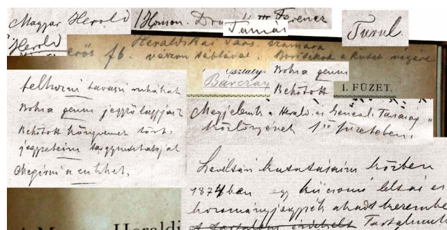
4. kép – A H és B betű, valamint a ductus összevetése Radvánszky egyéb ceruza-irataival.

Nekem már e személyes megtekintés alkalmával is az volt a véleményem, hogy a címlap bejegyzése a megtévesztésig hasonlít Radvánszky írására; ezért engedélyt kértem (és kaptam) arra, hogy az 1883-as évfolyamban felfedezett, fent írt bejegyzéseket lefényképezhessem. A (sajnos, nem túl jó) felvételek újbóli (tüzetes) vizsgálata alapján erősödött vélelmem, hogy a bejegyzés Radvánszkytól való; amely megállapítást a betűk (különösen pedig a nagy H és B) megformálására, valamint az egész írás ductus-ára alapozok (4. kép). 37 Radvánszky „ce-