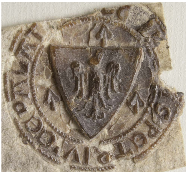
3. kép – Az alnádor pecsétje

fel szeretném majd használni. Fentebb láhattuk: a vicepalatinus typariumának egyetlen lenyomata maradt ránk, a dolgozatomban bevezetőjében idézett 1298. november 24-i irat zárópecsétjeként. Ennek mezejében központi motívumként egy ívelt oldalú háromszögpajzs szerepel, amely gyakorlatilag kitölti a mezőben rendelkezésre álló teret. A pajzsban kiterjesztett szárnyú sas látható. A pajzs felett és mellette kétoldalt pedig a már emlegetett hársleveleket ábrázolták. A körirat kifejezetten utal Péter hivatali tisztségére is: [SIGILLUM] C[O]M[IT]IS : PeTRI VICePALAT[INI]. 39