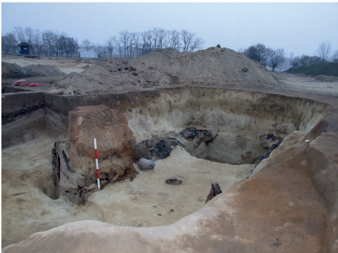
5. kép: A 223. objektum alaprajza és fotói. A pince gödrének hosszanti oldalait deszkaborítás fedte. A nagy alapterületű beásás közepén találtuk meg a szemeskályha omladékát. A vas depóelet és a bekarcolással díszített csonttárgy a betöltésből származik. Andrea Contarini (1367–1382) velencei dózse arany dukátja szórványként került elő a lelőhely területéről