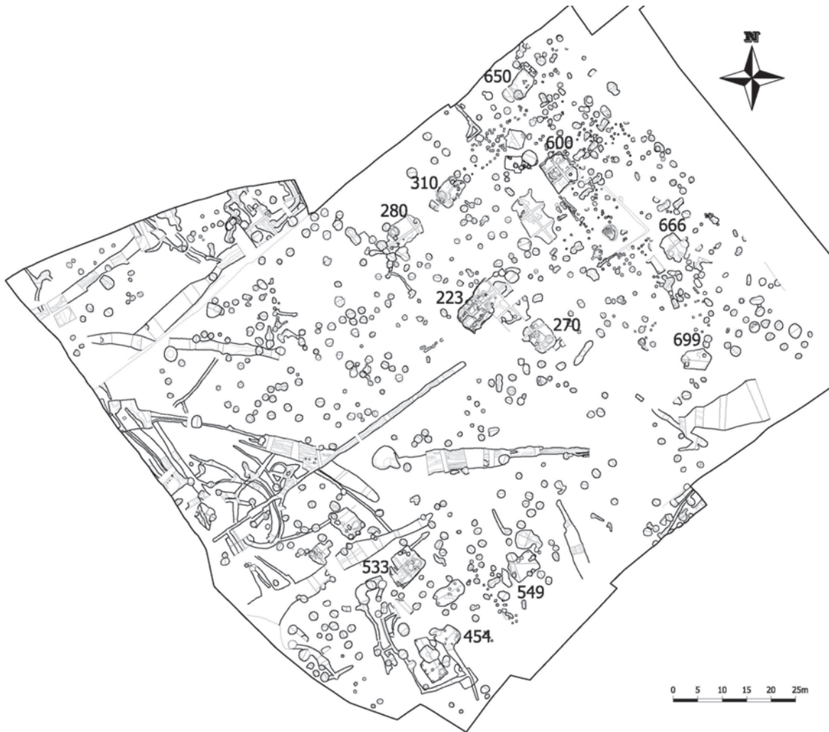
3. kép: Dabas középkori falujának központi magja. A földbe mélyített építmények körülveszik a lelőhely legnagyobb és leggazdagabb építményét (223. objektum)

dás. Megindul a jogilag egységes jobbágság kialakulása is és mindez elősegíti a telkek rögzülését, a települések stabilizálódását. 31 Az agrártechnikai fejlődéssel és társadalmi átalakulással párhuzamosan, a 13. században egy másik lényeges folyamat is lejátszódik: ugrásszerűen megnő a templomok száma és a rögzülő települések hálózata stabil plébániahálózattal egészül ki. A templom lesz a szabályos szerkezetű falu központi építménye, a település magja. Ugyanezt a központosuló folyamatot gyorsítja az egyre erősebb kézművesipari szakosodás, a piacra termelés. Valószínűleg nem tudjuk feltárni azon tényezők összességét, melyek létrehoztak egy-egy települést és determinálták fejlődését. A gazdasági termelői rendszer, a természetföldrajzi adottságok, a meglévő település- és úthálózat voltak talán a legfontosabb formáló erők. 32 Az egyes értékelések során azonban érdemes tekintetbe venni a templom pozícióját és korát, valamint a társadalmi hierarchia lehetséges nyomait is. Mindezek mellett létezhetnek olyan egyéni preferenciák, mint például egy földbirtokos telepítési szempontjai, melyekről részletesebb tájékoztatást nem adhatnak a forrásaink.