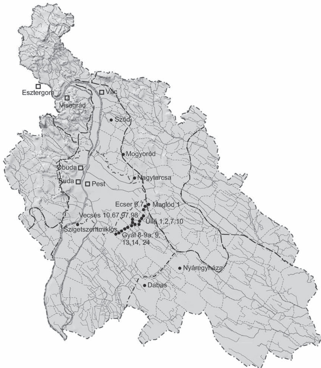
1. kép: Pest megye térképe az elmúlt 15 évben kutatott fontosabb Árpád-kori régészeti lelőhelyekkel. A négyzetek a királyi és egyházi központokat mutatják. (A tanulmány minden térképét Erdi Benedek készítette)

A házak szegényes leletanyaga általában háztartási kerámiából, kevés vas- és bronztárgyból, állatcsontokból tevődik össze. Mindössze Gyál 3. lelőhelyen került elő néhány grafitos anyagú kerámiatöredék és egy mázas bizánci(?) vagy balkáni(?) korsó, amely külföldi eredete és különleges minősége miatt egykori birtokosának kiemelkedő státuszára utalhat. Ez volt az egyetlen az M0-s autópálya 23 Árpád-kori lelőhelyéből, ahol a házaknak deszkapadlója volt, vagy legalábbis ahol sikerült ilyet dokumentálni. 10 A fenti adatok alapján az általunk vizsgált területen fekvő telepnyomok, vagy inkább lelőhelyek egy kivételével azonos helyet foglaltak el a hierarchiában. A társadalmi csoportok írott forrásokból ismert változatossága mintaterületünk régészeti adataiban nem jelent meg.