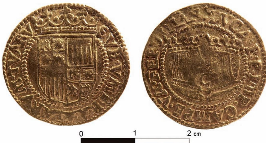
6. kép: Ferdinánd és Izabella arany dukátja a visnyeszéplaki leletből, Hollandia, Kampen