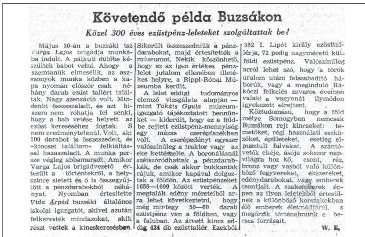
4. kép: Újságcikk a buzsáki éremleletről