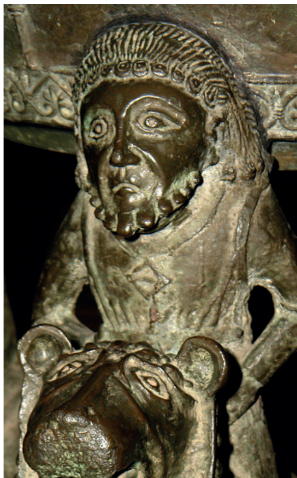
4. ábra. A Brémai dóm keresztelőkútjának egyik alakja, aki rombuszalakú brosst hord

A mérettel kapcsolatban egészen biztos nem a ru- hacsat-övcsat viszonylatban van összefüggés. A haszná- latból adódó tapasztalatok alapján a csat mérete inkább azt határozza meg, hogy az adott darab felsőruha nyaká- nak összefogására, vagy köpenycsatnak alkalmas. Illetve a nagyon nagy (lásd Ekkehard és Uta Naumburgi szob- ra), (6. ábra) vagy nagyon kicsi (lásd a Kánán előkerült