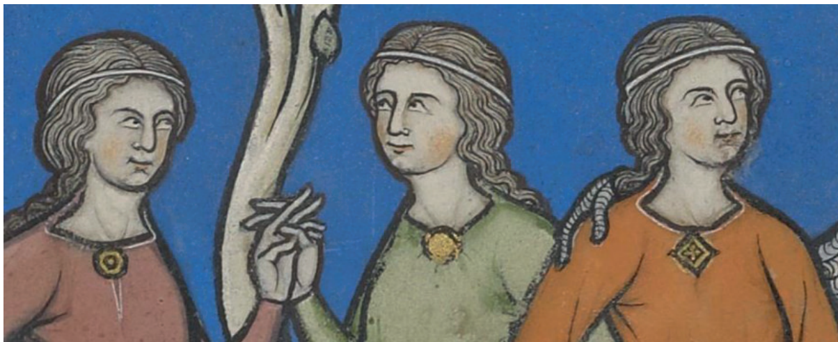
3. ábra. Különböző brossok viselése a 13. századi Maciejowski Biblia 17r oldalán: A Morgan Library weboldala < https://www.themorgan.org/collection/crusader-bible/33 > (Letöltve: 2024.04.16.)

tott csattest egyik felének eltakarása az öv anyagával, ad- dig ez egy keleti népcsoport esetében talán nem jelentett problémát. Felvethető az a magyarázat is, hogy a kunok egy rövid ideig a 14. században egyfajta szőttes övük két végét tűzték össze brossokkal. Továbbá hordhatták a brossokat az egyszerűen csomóra kötött övükön díszként, funkció nélkül, „kitűzőként” is.