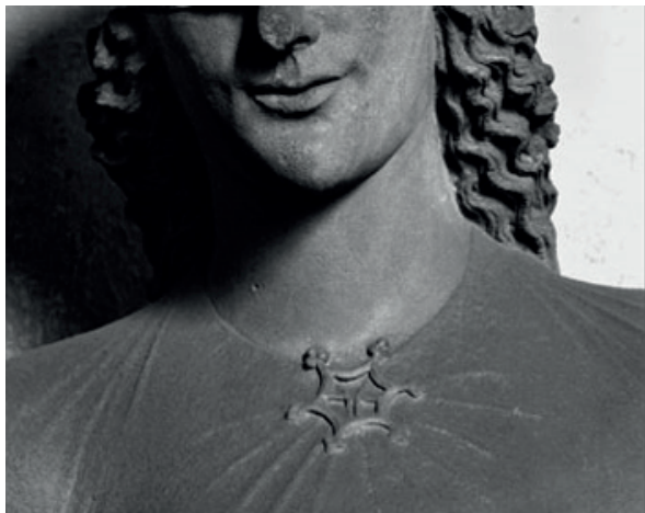
7. ábra. A Bambergi katedrális hercegi portálján az egyik szobor nyakában egy csillag alakú bronz látható: Dagfari kézműves weboldala < https://dagfari.net/img/cms/vrcholn%C3%BD/1230-1240-%20Bambersk%C3%BD%20d%C3%B3m.PNG > (Letöltve: 2024.04.16.)