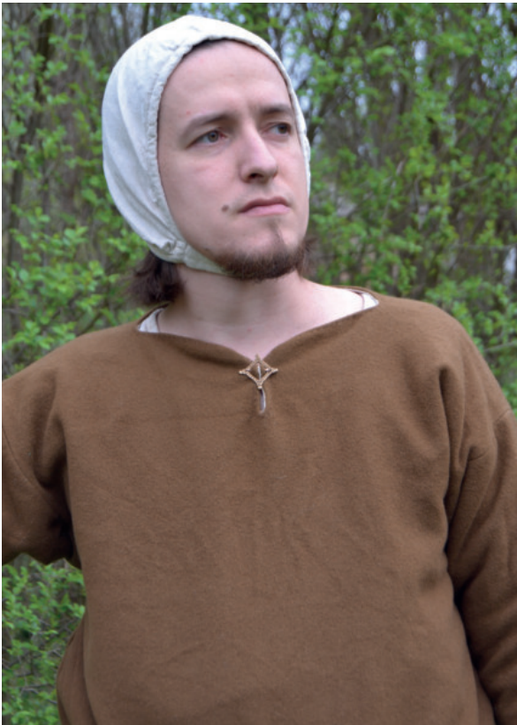
1. ábra. A Kaposvári rombuszalakú ruhacsat helyes viselése 13. századi ruházattal

jukon, köpenyükön. Ennek ellenére talán Pálóczi Horváth András 4 és Szabó Kálmán 5 óta rendszeresen jelennek meg egyértelműen tunika nyakának összefogatására használható ruhacsatok övcsatnak titulálva.