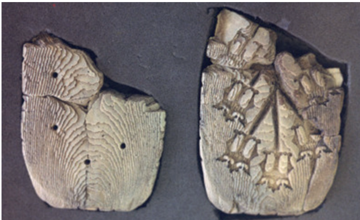
12. ábra. Szépiacsontba faragott öntőminta a Museum of Londonból: Gaukler Medieval Wares weboldal < https://medievalwares.com/brooch%20manufacture/Cast%20Brooch.html > (Letöltve: 2024.04.16.)

A modern öntési eljárás, során az ötvös a tárgy modelljét kifaragja viaszból, ezt a viaszt körbeönti gipsszel. A tárgyról így keletkezik egy negatív, melyből melegítésel kifolytatják a viaszt. Utolsó folyamatként pedig vákuum alatt beleöntik a mintába az olvadt fémet.