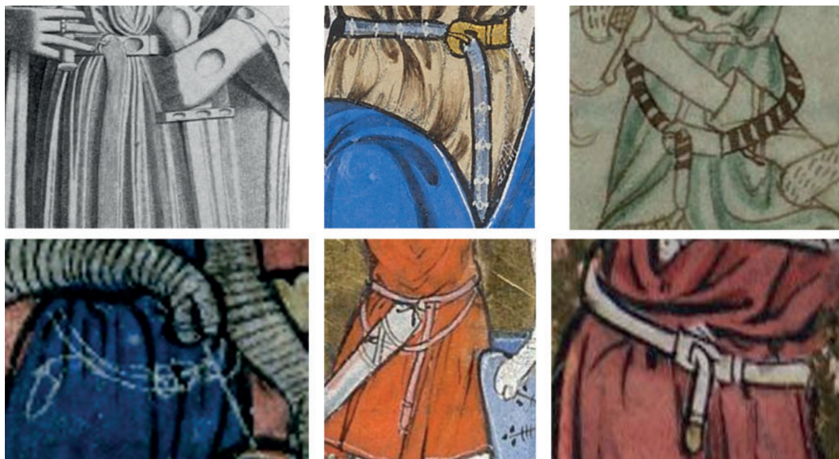
5. ábra. Az öv helyes hordása 13. századi ábrázolásokon