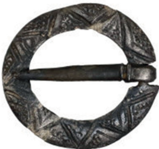
11. ábra. A kaposvári kör alakú broszhoz nagyon hasonló darab Norfolkból. Portable Antiquities Scheme weboldal < https://finds.org.uk/database/artefacts/record/id/928834 > (Letöltve: 2024.03.29.)

Anyagtól függetlenül elsőként egy sima felületbe faragták az öntendő tárgy negatív mintáját és egy beömlő nyílást alakítottak ki a tárgy szélétől a mintába. A mintát tartalmazó oldalt összefordították egy ugyanabból az anyagból készült minta nélküli, de beömlő nyílással rendelkező ellendarabbal. Ezt a két tárgyat összeszorították,