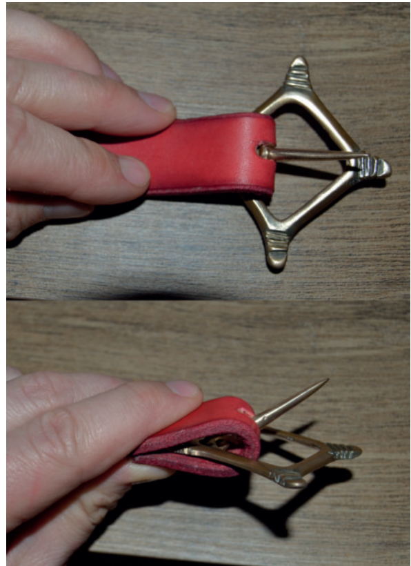
2. ábra. Övcsatként való viselés esetén a csatkeret és a szíj folyamatosan egymást feszítenék. Tengely híján a derékon sem feküdne fel rendesen az így szerelt öv

Értelemszerűen nem zárható ki egyes esetekben a brossok más módokon való használata. Gondolok ez alatt elsősorban az „övcsatként” való felhasználásra. Összefoglalva azonban a rombusz-, csillag és sokszögalakú brossoknál ezt a használati esetet elvetném (2. kábra). A nem kör alakú brossoknál a szíj feltétele nem reális. Ezt a csattest csúcsai kifejezetten gátolják. A középkori csatok ritkábban kör alakúak, inkább D formájúak, de általánosan van egy egyenes tengelyük, amire a szíj, vagy a szíjat tartó lemez kapcsolódhat. Hatházi Gábor is övcsatként azonosított egy olyan alakú csatot, amire szíjat tenni használható módon lehetetlen. 6 A kör alakú brossoknál nagyobb eséllyel elképzelhető az övcsatként való használat. Itt azonban sok esetben a csattest díszített. Fogas Ottó, gótikus feliratos csatokkal foglalkozó munkája alapján is ezeket a kerek példányokat találták meg, főként a medence közelében. 7 Véleményem szerint egyébként, a kun temetkezéseken talált 14. századi ruhacsatok övként való használata nem az általános magyar viseletre mutat