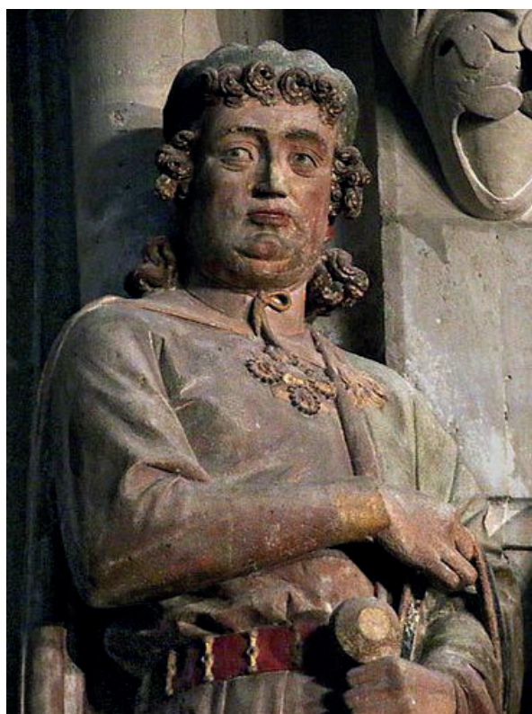
6. ábra. A Naumburgi Katedrálisban található Ekkahard szobor, melyen egy nagyméretű díszítő brosz látható

bross 12) ruhacsatoknál csak dísz funkció feltételezhető. Ennek egyszerű oka van, a ruhacsat belső tere meghatározza, hogy milyen vastag ruhát lehet vele összefogni. Egy tunika nyakához elegendő a 2,2×2,2 cm befoglalójú brosz is, míg egy köpenyéhez ennél nagyobb a kényelmesebb. A korabeli köpenyek ugyanis általánosan félkör szabásúak voltak. Ezeket, amennyiben brossal zárjuk össze az anyagot, kissé össze kell gyűrni, mely nagyobb belső térrel egyszerűbb. A nagyon kicsi brossok belmérete nem teszi lehetővé, hogy két réteg gyapjuszövetet, ami a kor felsőruházatának alapvető anyaga volt, átszúrjunk a tűvel és ez az anyag beférjen a csattestbe. A kaposvári rombuszalakú és a szőkedencsi példányon is megfigyelhetőek a hordásból eredő torzulások. A kaposvári csattest a minta felőli oldaláról nézve enyhén homorú. A szőkedencsi példány túje a csattest felé homorú. Mindkettő sérülés azt mutatja, hogy nagy feszítőerő hatott a tárgyra a belső oldaluk felé.