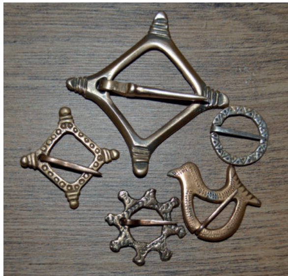
8. ábra. Az elkészített bronz rekonstrukciók