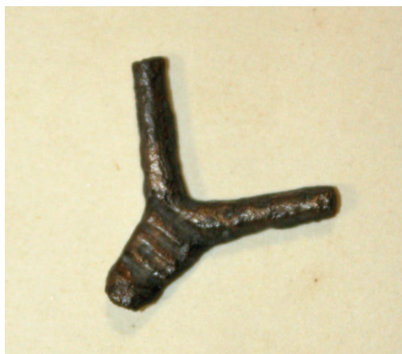
9. ábra. Az Iharosberényi bronz töredéke

Nyolcágú, csillag alakú bronzbronz, mely szórványként került elő szép állapotban. Az egyik csúcsa sérült, több csúcsa öntési hibás. Ezeket a helyeken megfigyelhető, hogy a bronz nem folyt be eléggé az öntőmintába. A csattest végig kör alakú mintával díszített. A csat mérete 3x3 cm, nyelve teljes egészében megmarad. A bronz rekonstrukcióját tunika nyakának összezárására használjuk.