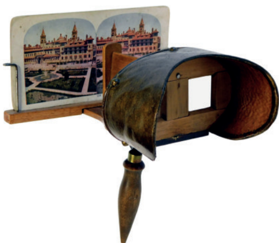
15. ábra. Amerikai típusú kézi sztereónéző az 1910-es évekből Isz.: 95.2.1