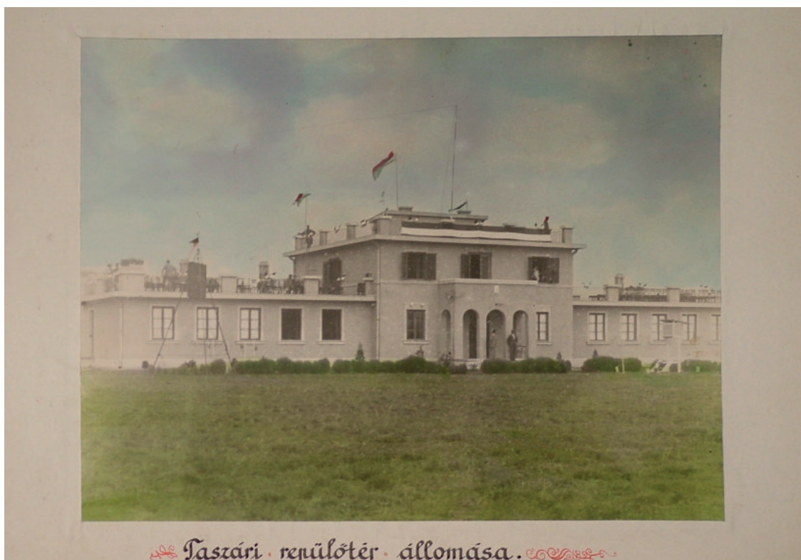
7. ábra. A taszári repülőtér állomása. 1932. („Vétek Györgynek, Kaposvár polgármesterének, polgármesterségének 10. éves évfordulójára” készült albumból. Isz.: 4358)