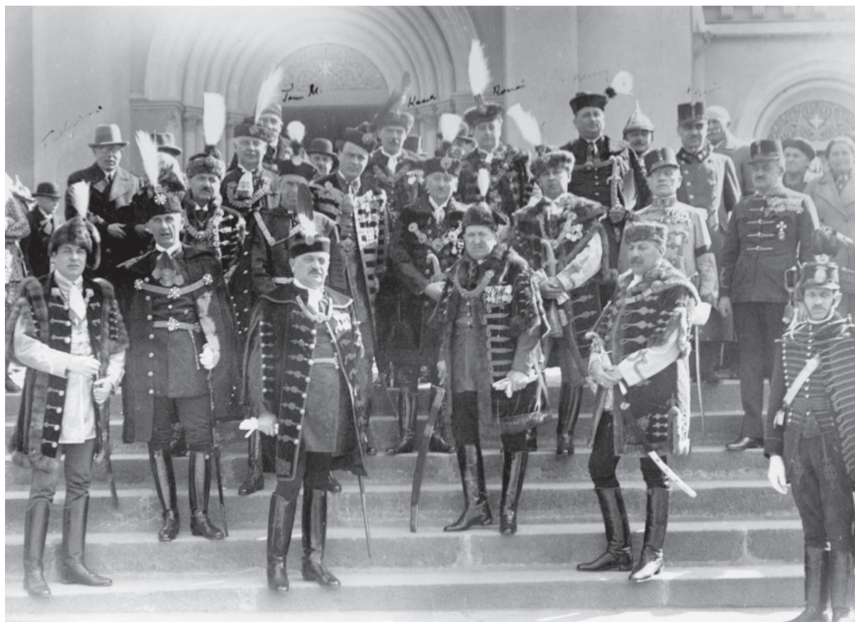
4. ábra. Nagybarcsai Barcsay Ákos főispán beiktatásakor a templomból kijövő notabilitások csoportképe.