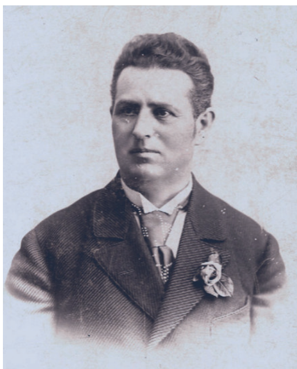
18. ábra. Somogyi Károly színikazgató. 1896 lsz.: 37019