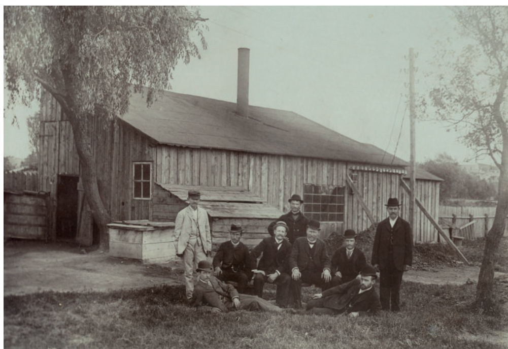
6. ábra. Az első kaposvári villanytelep épülete, 1893. Isz.: 3375