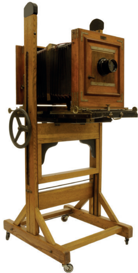
11. ábra. Goldmann Wien alapdeszkás műtermi fényképezőgép, 1920-as évek. Isz: 2014.1.1.