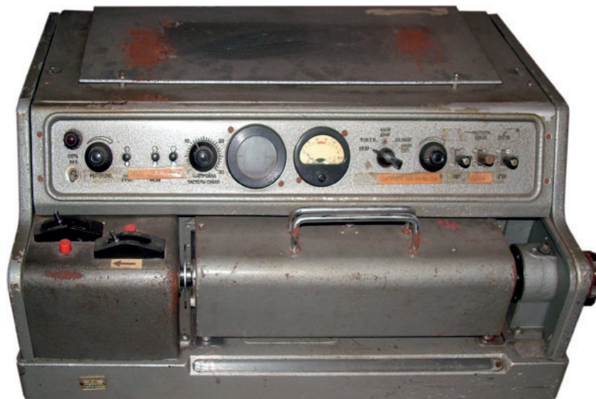
12. ábra. A Somogyi Néplap „Néva” képtávírója gysz.: 11/92