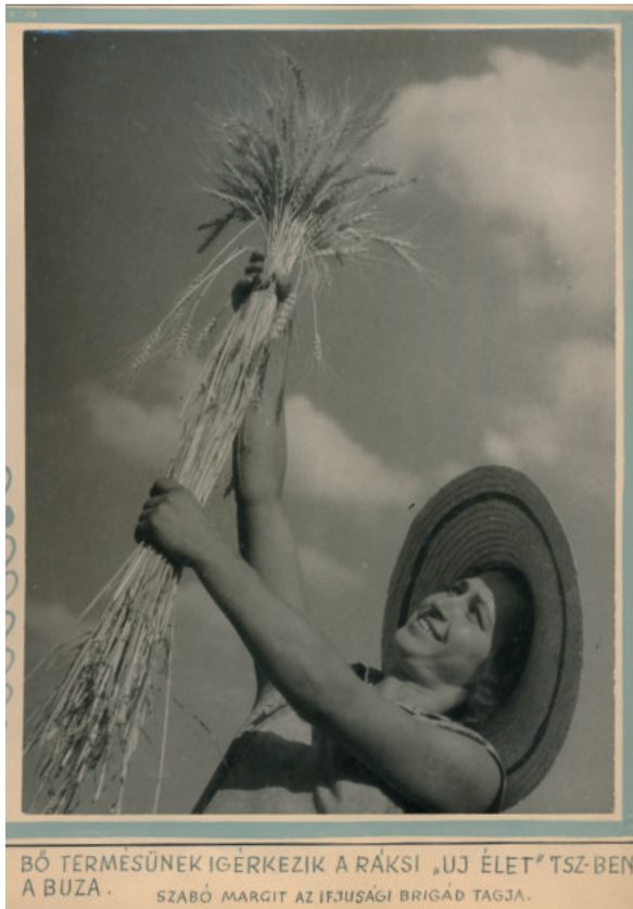
10. ábra. „A BÚZA”. 1956 körül (Somogy megye a felemelkedés útján című albumból. Isz.: 94.30.1.1)