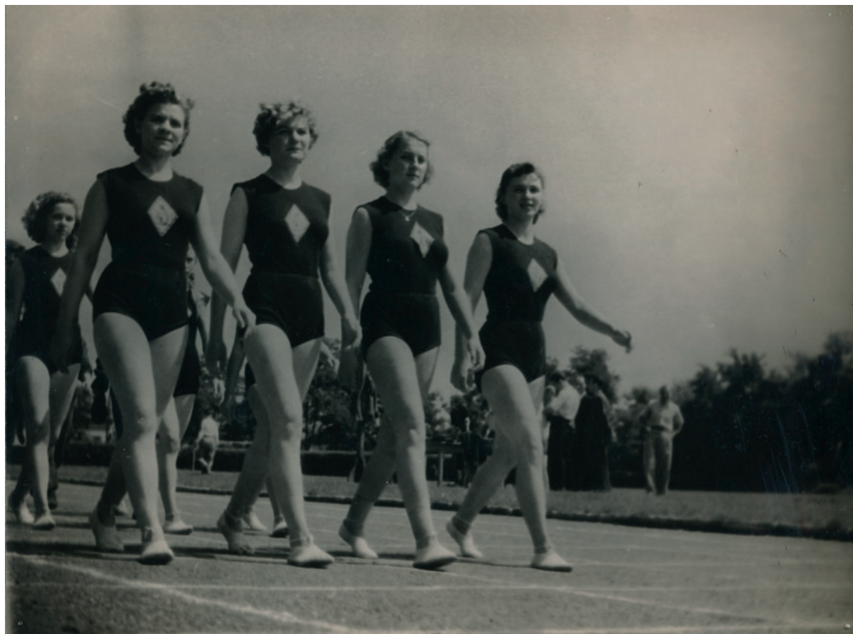
9. ábra. A kaposvári Dózsa sportkör tornászlányainak felvonulása. 1956 körül (Somogy megye a felemelkedés útján című albumból. Az album felvételeit készítette: A Magyar Fotó, A kaposvári Járási Tanács Fotó és Városi Tanács Foto szakköre. Isz.: 94.30.1.1)