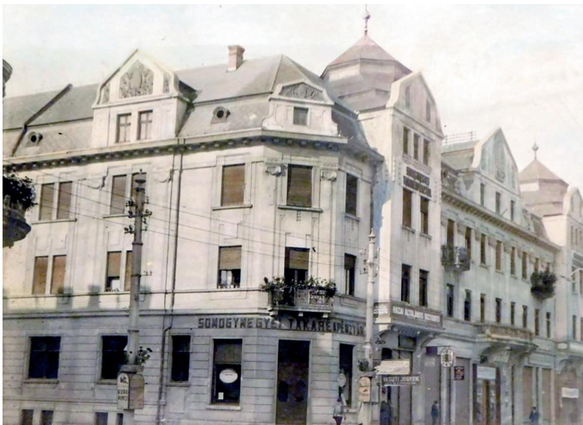
17. ábra. A kaposvári „Anker-ház”. Szatmári Béla felvétele, 1930-as évek lsz.: 33715