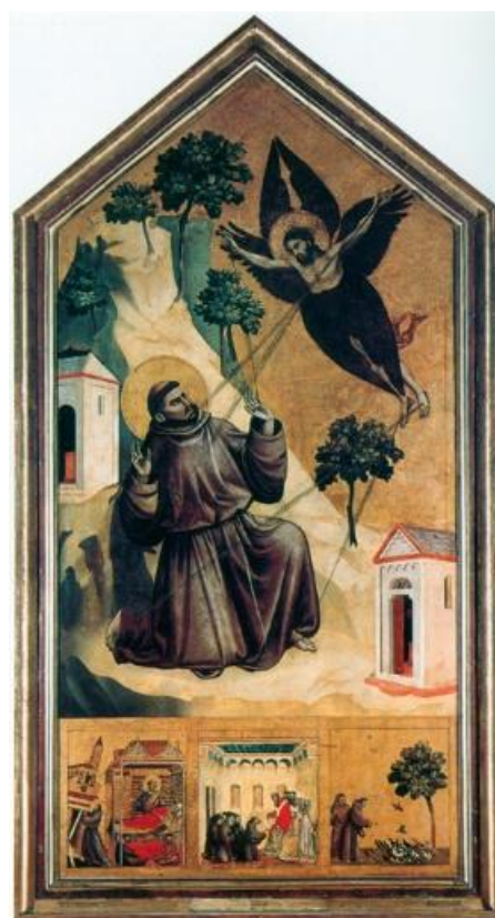
3. ábra. Giotto. 1300 k. Paris, Louvre.

Frugoni téziseit sorra véve újra elemzi Cortonai Illés enciklikus levelét, Leó testvér Rubricáját és Celanói Tamás legendáját. Arra a következtetésre jut, hogy a Frugoni által feltételezett ellentmondások magyarázhatóak és kiküszöbölhetőek: Illés pontatlanságait érthetővé teszik a gyász megrendítő első pillanatai, Leó rubricájában a fogalmazás azt fejezi ki, hogy a szeráf-látomás és a stigmatizáció ugyanannak a „beneficium”-nak az egybefüggő két aspektusaként kerül említésre, és a stigmák „benyomatása” ( impressio ) testi és nem spirituális jelenségre utal. Az a tény pedig, hogy a Leóhoz köthető Assisi kompiláció nem említi a stigmákat a Verna-hegyi szeráf-látomás elbeszélésénél, nem bizonyítja azt, hogy Leó ezek létezését tagadta volna, hiszen később maga is beleírta a Rubricá -ba. Celanói Tamás legendáját pedig nem egyszerűen a két elsődleges tanúság összeegyeztetésének, hanem alapos konzultáció nyomán összeállított, számos eredeti adatot elsőként közlő eredeti forrásnak kell tekinteni. Az e három forrásban fellelhető egybecsengő adatokból kiderül, hogy Ferenc holttestén számos tanú láthatta a Krisztus stigmáihoz hasonló sebeket, és ezeket néhányan még életében is megpillanthatták – ennek alapján a stigmák létezésének tényét nem lehet kétségbe vonni. Egy másik kérdés, amire nem tudhatjuk a választ, az, hogy mi (vagy ki) ezeknek a sebeknek az oka, okozója – ezt csak maga Ferenc tudta volna elmondani, de ezt nem tette.