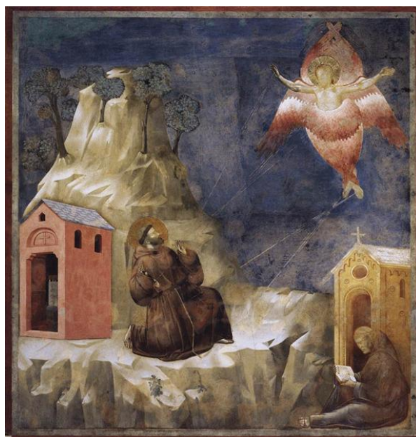
4. ábra. Giotto, 1320 k. Firenze, Santa Croce, Cappella Bardi

Jacques Dalarun után újra hozzászólt a stigma kérdéséhez André Vauchez , aki 2009-ben jelentette meg François d'Assise. Entre histoire et mémoire (Assisi Ferenc a történelem és az emlékezet között) című monográfiáját. Pontos és részletes leírást adott a stigmatizációval kapcsolatban fennmaradt források sokszínűségéről és egymás közti ellentmondásairól. Különös figyelmet szentel annak, hogy Bonaventura hogyan próbálta – szerinte sikerrel – feloldani ezeket az ellentmondásokat egy koherens krisztológiai értelmezésben, mely a Ferenc testén megjelenő stigmákat a látomásban megjelenő szeráf-Krisztussal való azonosulási vágy szeretetelli forróságával magyarázza. Kiemeli, hogy Ferenc stigmatizációja isteni „pecsét” ( sigillum ) a ferences rend reguláján, és ezáltal Ferenc szerepe eszkatológiai jelentőségre emelkedik: „napkeletről egy másik angyal száll fel, az élő isten pecsétje volt nála” (Jel, 7, 2), a Krisztus stigmáit viselő Ferenc fellépése egy új korszak kezdetét jelenti az emberiség történelmében. Ezután áttekinti a stigmatizáció valóságát bíráló kortárs ellenreakciókat (lásd VAUCHEZ 2009, pp. 204-206, 324-335).