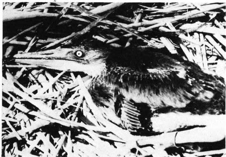
LXIV. I, IV = Barna rétihéjék ( Circus aruginos ); II = Egyik legnagyobb hazai sirályfajunk a dankasirály is fészkel Somogyban; ( Larus ridibundus ) III = Űstökös géme (Ardeola ralloides); V = Vörös géme ( Ardea cinerea ); VI—VII = Kűszvágó csérek ( Sterna hirundo ).