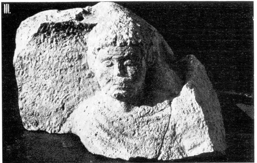
LXXV. Kaposszentjakab, I = pillérfő; II = oszloplábazat a XI. századból; III = római sírkő. – I = Pfeilerkopf; II = Basis aus dem 11. Jh. III = Römisches Grabstein.