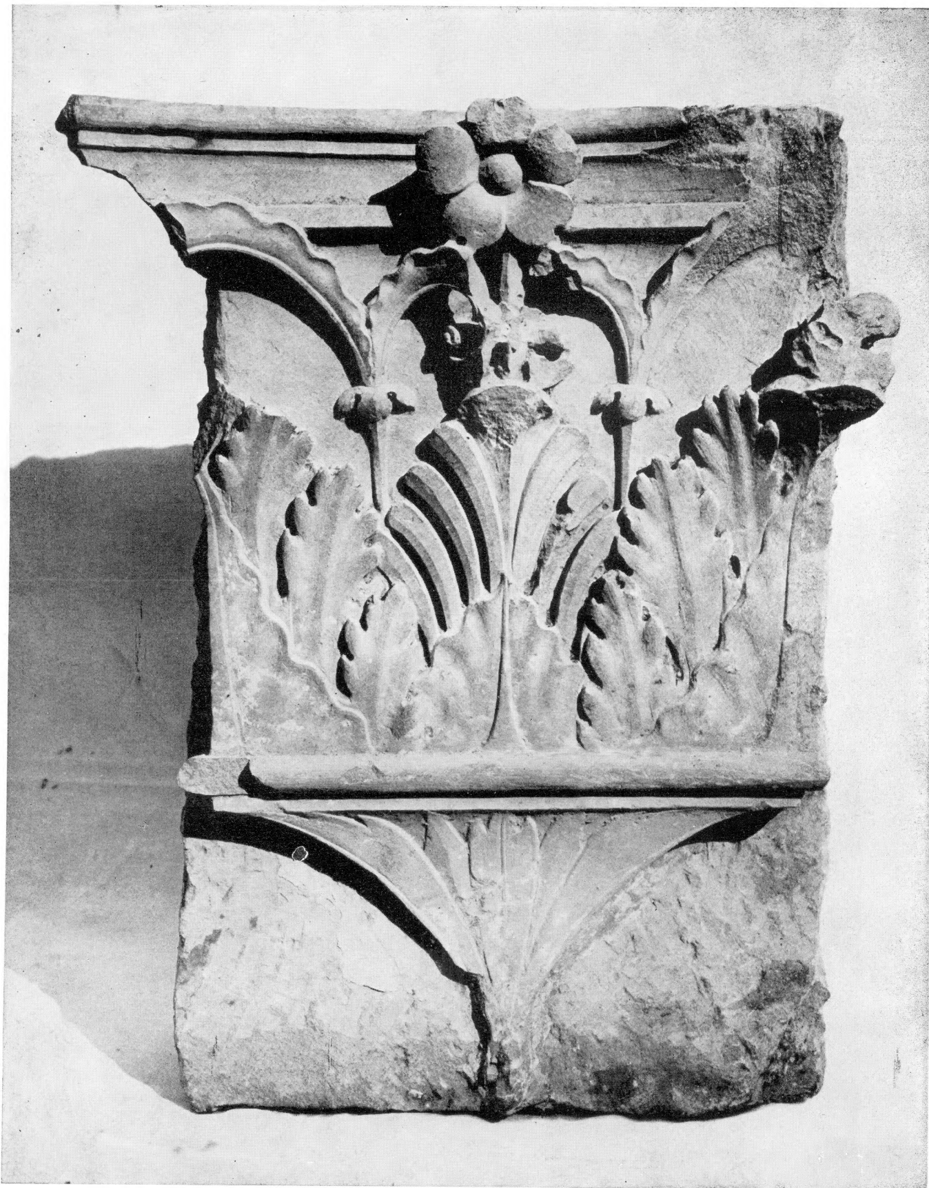
LXXX. Ötvöskőnyi, XV. századi mészkő pilaszerfejezet. – Pfeilerkopf von Ötvöskőnyi, aus dem 15. Jh.