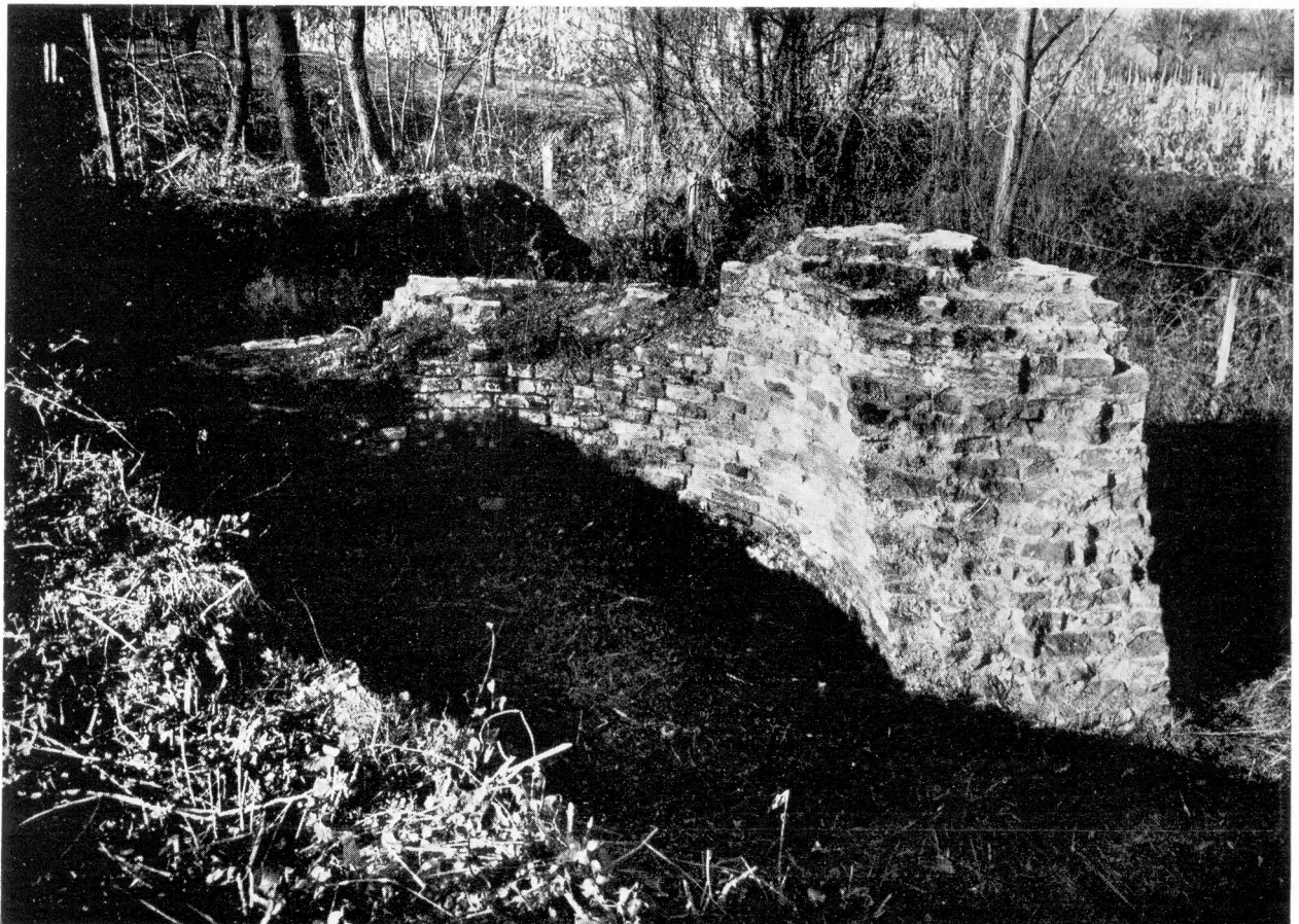
LXXIX. Ötvöskőny. I = a várkastély egyik fala; II = az egyik saroktorony (rondella). – I = eine Mauer des Schlosses; II = ein Eckturm (Rondell).