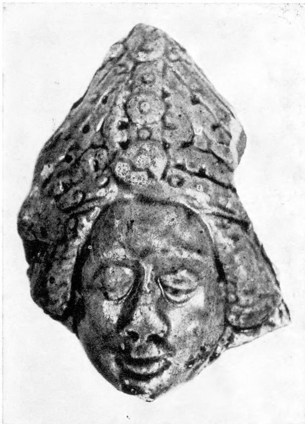
79. Ötvöskönyi, figurális kályhacsempe, XVI. század, 1:2 – Ofenkachel mit Figurenverzierung aus Ötvöskönyi, XVI. Jh.

A várkastély pusztulásához – a várháborúk ostromain túl – a vár későbbi, XVII. század végi – XX. századi használói nagyban hozzájárultak. S ezeknek a pusztításoknak a régészeti nyomait találta meg főként feltárásunk.