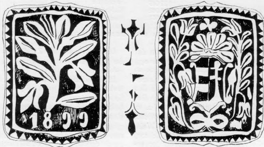
29. Az RRM 10783. gyufatartójának díszítése. – Verzierung des Zündholzbehälters Nr. 10783 im Rippl-Rónai-Museum. 1:1