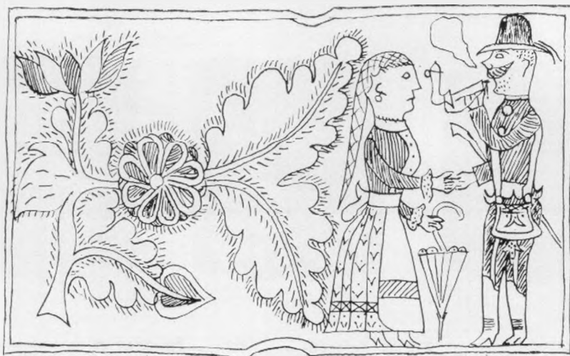
28. Az RRM 6738. sz. gyufatartójának előlapja. – Vorderseite des Zündholzbehälters Nr. 6738. im R.–R.–M. 2:1