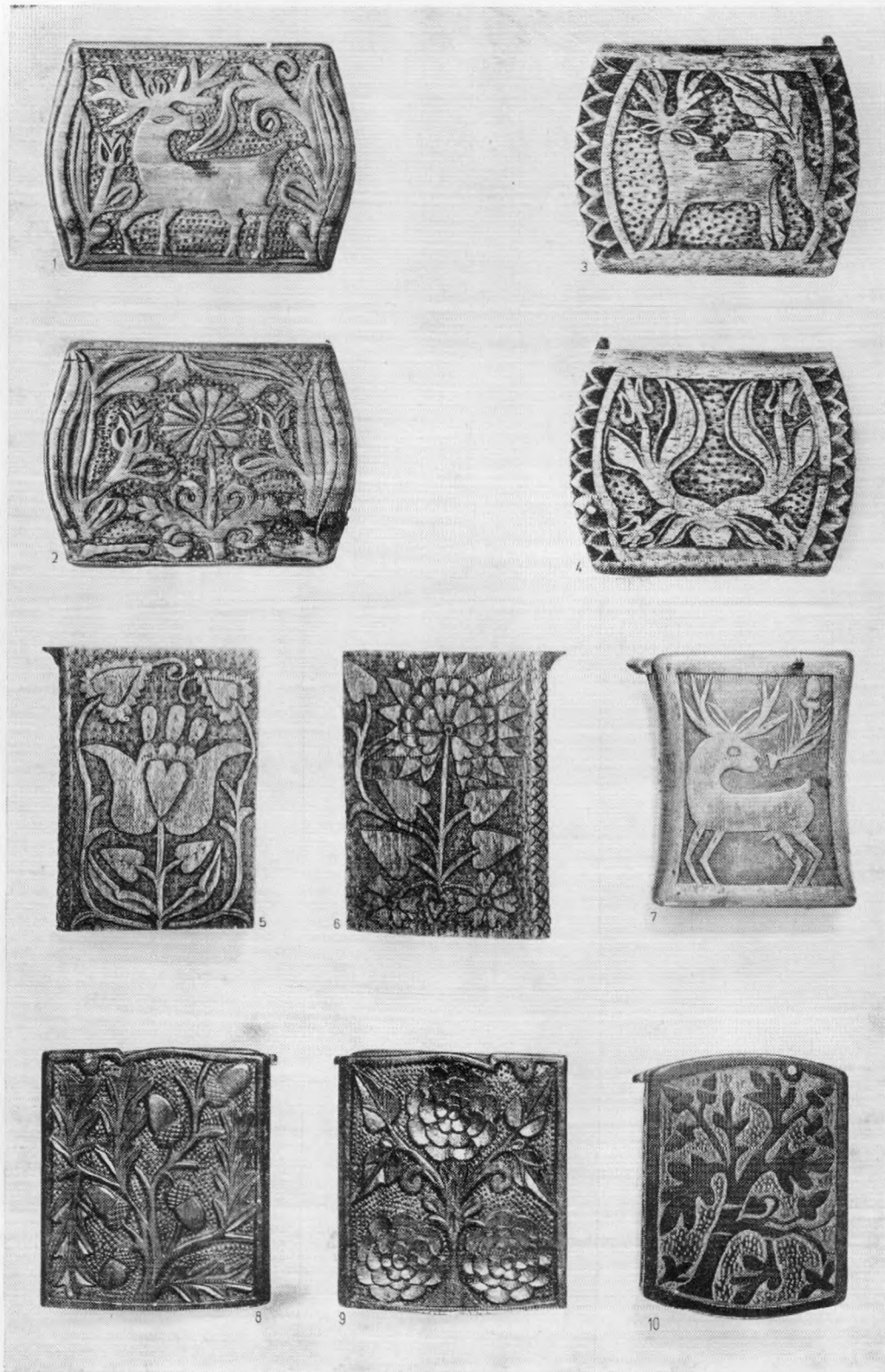
XV. A Rippl-Rónai Múzeum faragott gyufatartói. — Geschnitzte Zündholzbehälter im Rippl-Rónai Museum. 1:2