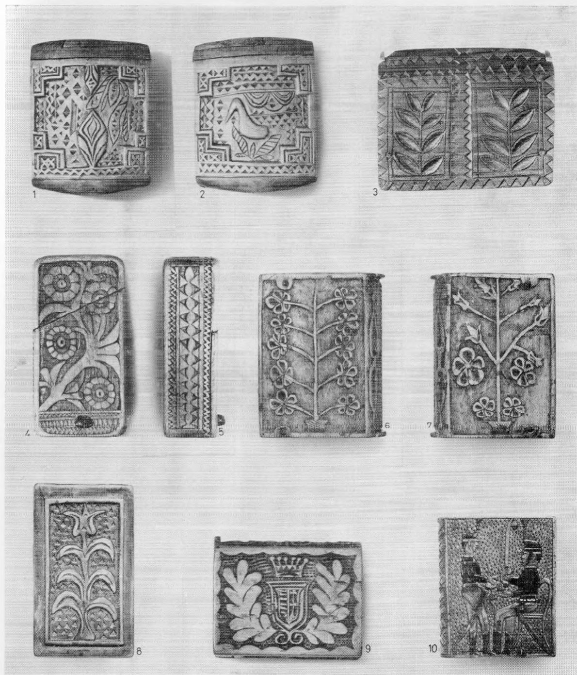
XIV. A Rippl-Rónai Múzeum faragott gyufatartói. – Geschnitzte Zündholzbehälter im Rippl-Rónai Museum. 1:2