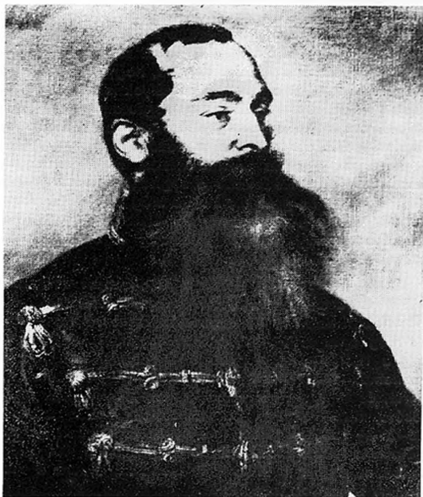
Kmety György (Brocky Károly festménye)

Az olasz forradalmi mozgalmak elfojtására az ezredét Itáliába vezényelték. Azután 1848 nyarán Melczér ezredes hadsegéde, akit időközben a magyar hadügyi államtitkárnak kineveztek. Itáliából Kmetyt ezután egy századdal Óbecsére, a szerb felkelők ellen irányították. Rövidesen a Győrben alakuló 23. honvéd zászlóaljba lép, ahol százados, majd őrnagyi rangban zászlóaljparancsnok. A zászlóalj kiképzése, hadrafoghatósága, a fegyelemhez szoktatása Kmety György érdeme volt. Egyik, máig is legrészletesebb életrajzírója Thurzó György szerint, Kmety parancsnoki munkájában „szeretetre méltó bánásmódja, túl nem csigázott szigorúsága, elfogulatlan igazságos ítéletei, zászlóaljának a szeretetét és becsülését szerették meg.” 3