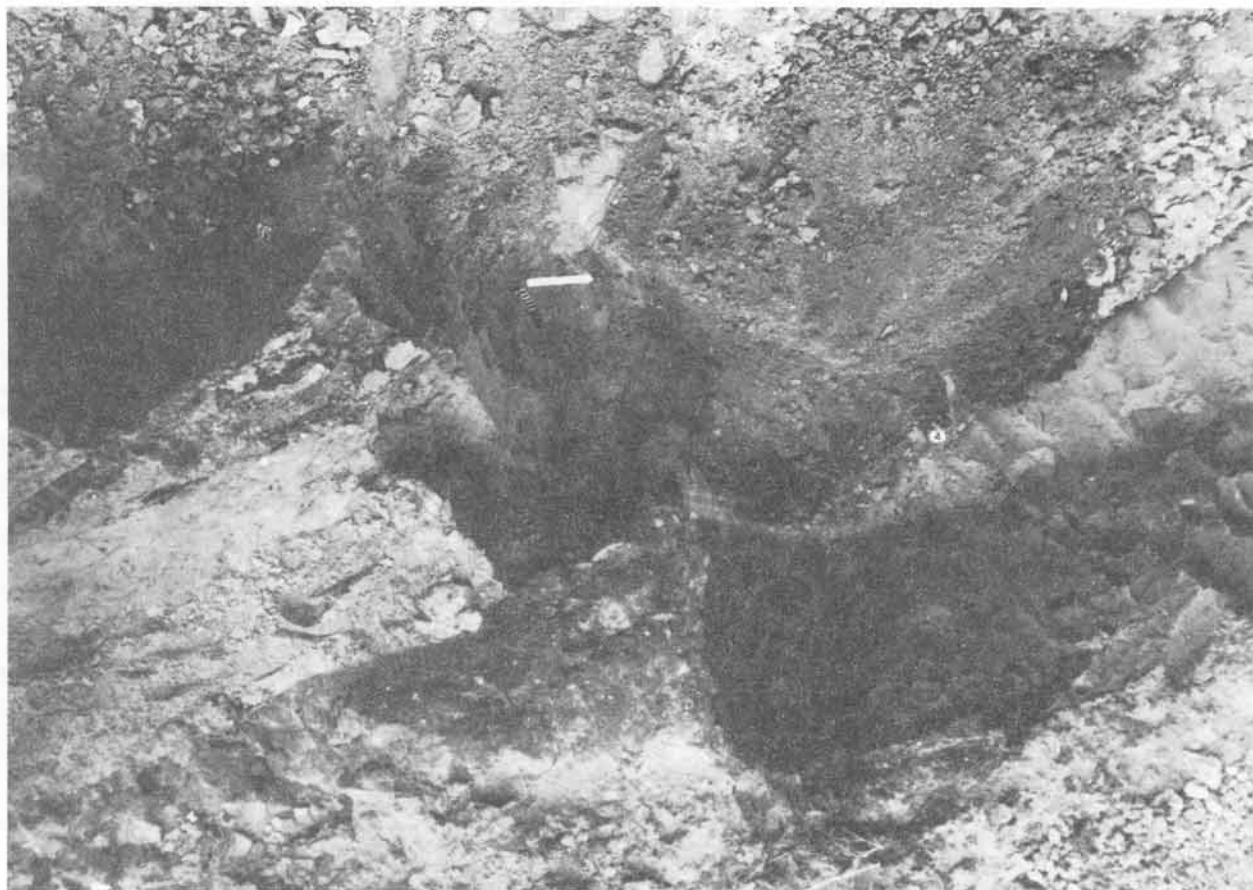
2. kép: A sír megmaradt része a pince gödrének falában