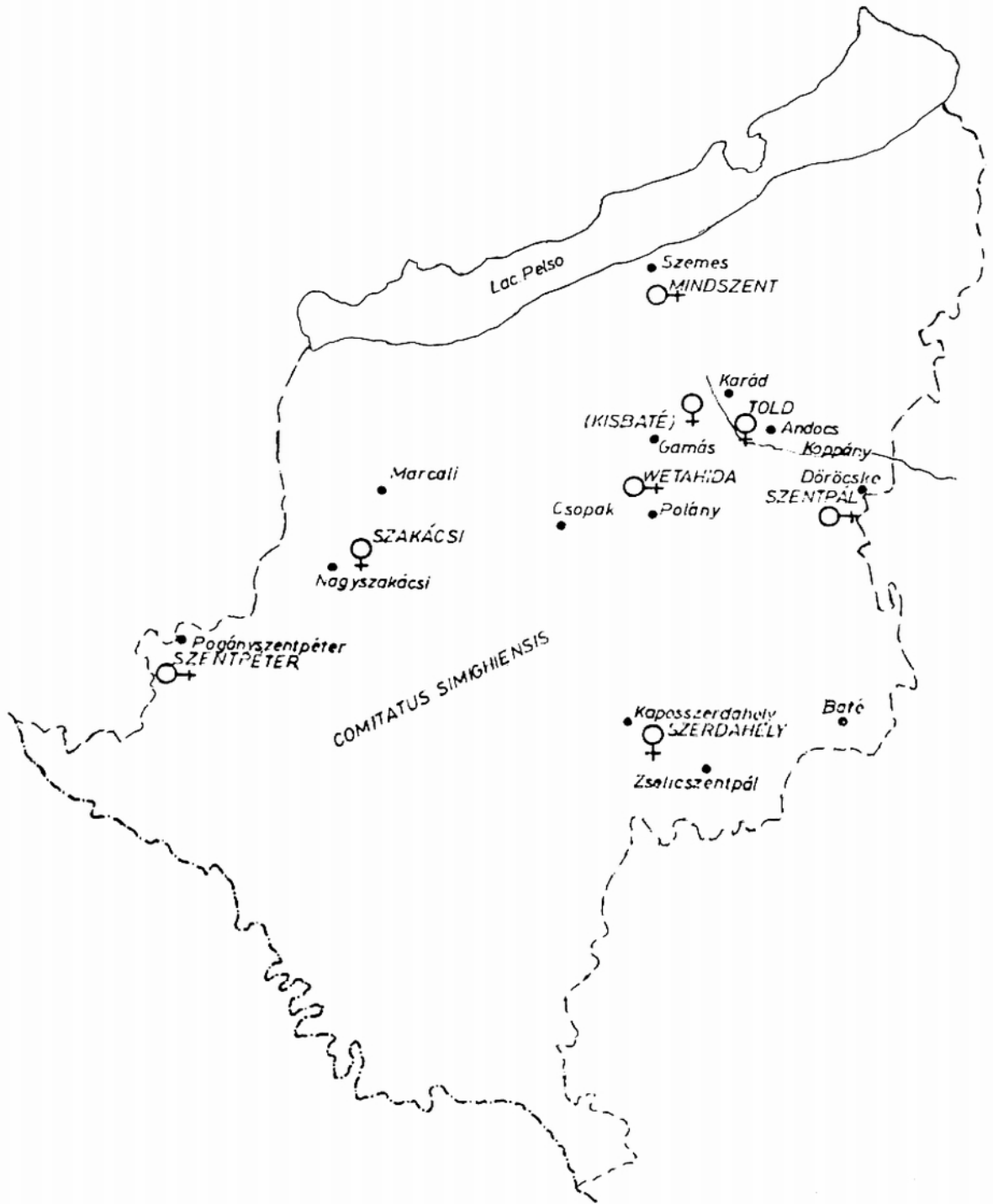
1. ábra: Pálóc kolostorhelyek Somogy megyében. (Jelölések: O+= romjaiban vagy terepnyomokban felismerhető kolostorhely; ♀= nem felismerhető kolostorhely; * = a tanulmányban említett, azonosításra szolgáló községek.) (Guzsik Tamás: Somogy megye múltjából, 1986. Szerk.: Kanyar József)