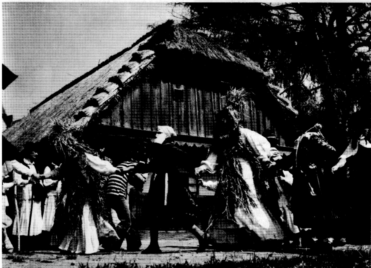
A „Röpülj páva” vetélkedő televíziós felvételei a Szennai Szabadtéri Néprajzi Gyűjteményben