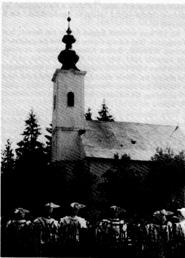
A „Repülj páva” vetélkedő televíziós felvételei a Szennai Szabadtéri Néprajzi Gyűjteményben

születésnapja alkalmából és kéri Együd türelmét a „Búcsúsok és istóriások” kézirat lektorálását illetően, hivatkozva egyéb, sürgős teendőire. 44 Egy másik levélben megköszöni somogyi kedves fogadtatását: „Igen jól éreztem magamat köztetek, bár ez így volna egész néprajzos társadalmunkban”. 45