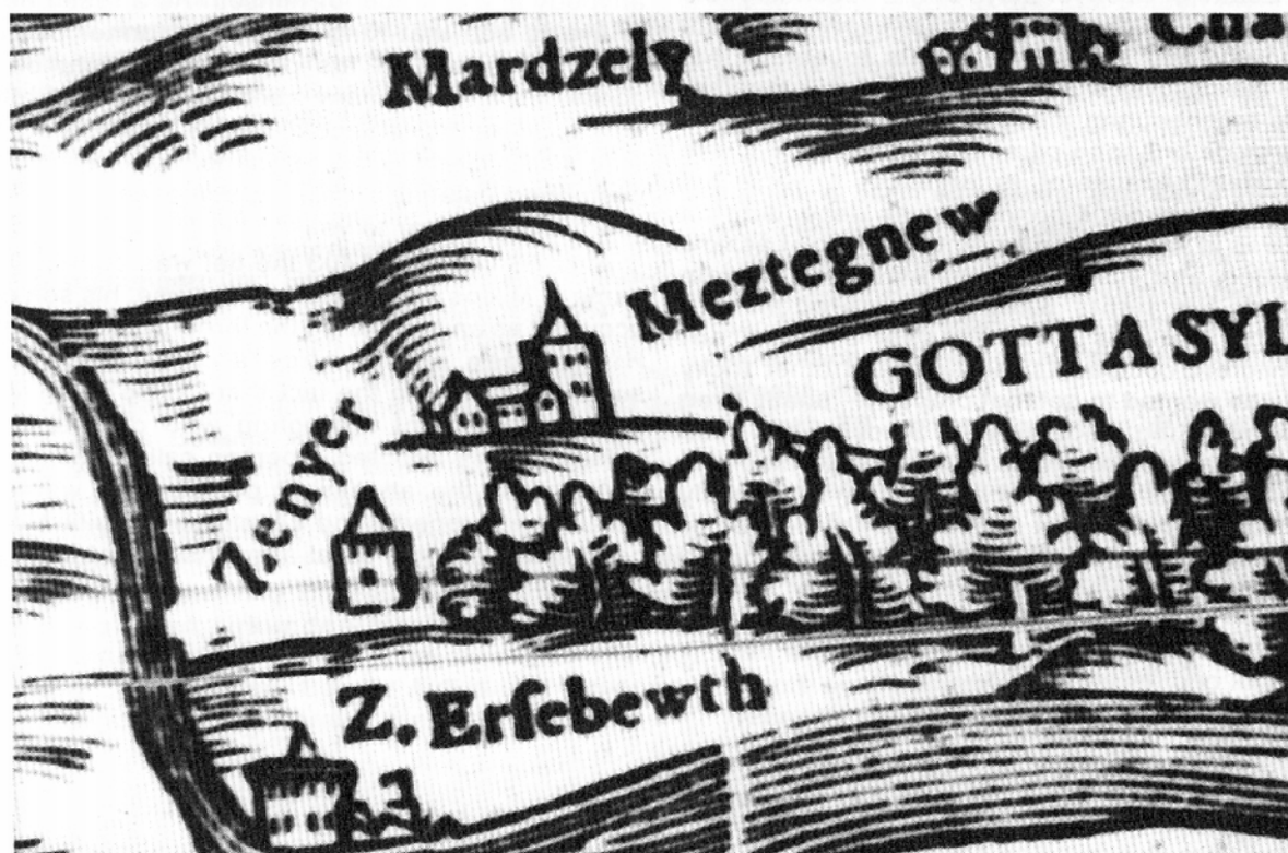
2. kép. A szenyéri vár Wolfgang Lazius 1556-os térképén. (Részlet) Hadtörténeti Múzeum Bp. (Reprodukció: H-né Szentés Magdolna)

– A két település sorsa ezidőtől egy ideig közös... (2. kép)