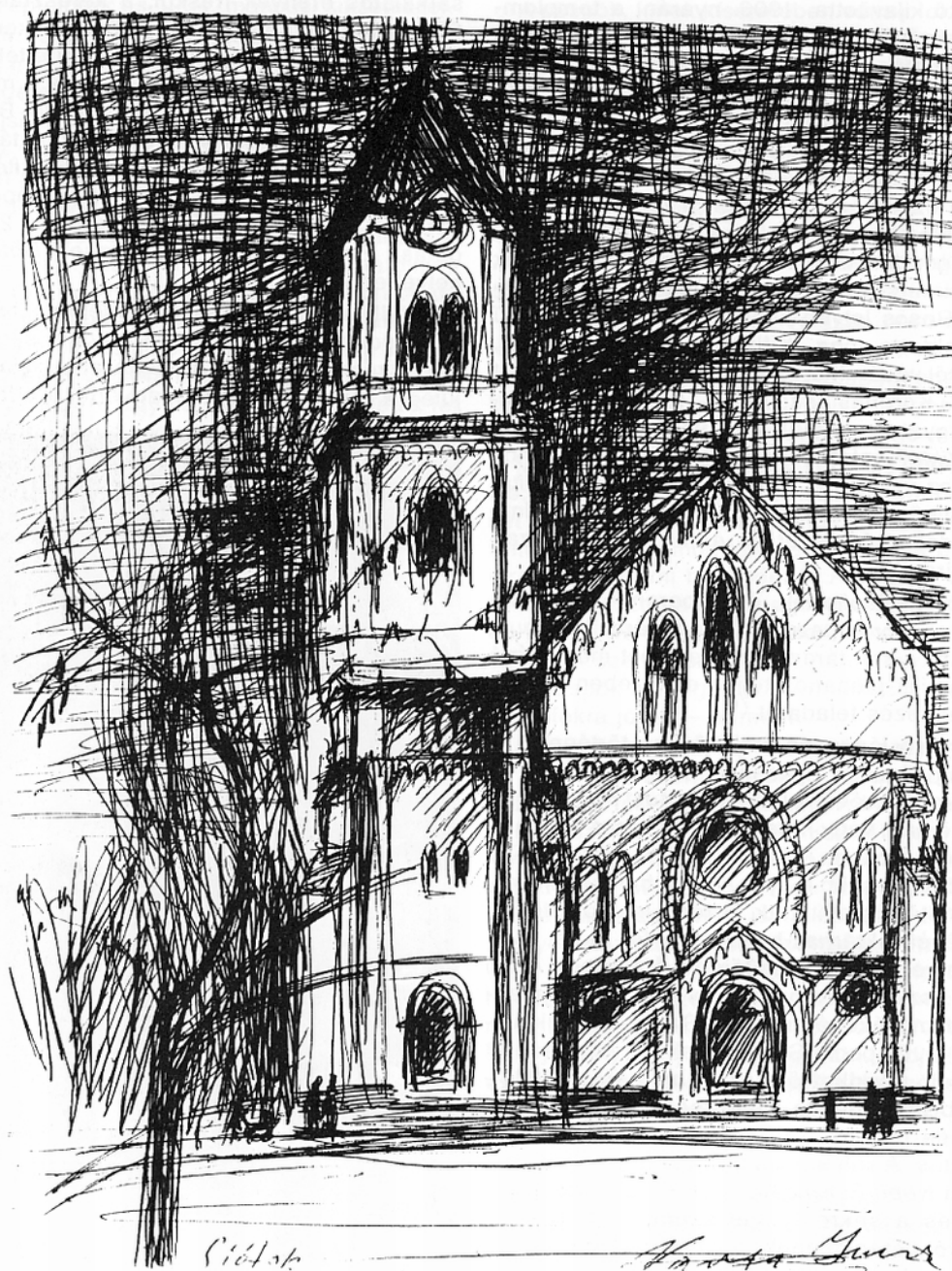
3. kép. A jelenlegi templom, (1993) (Varga Imre szobrászművész rajza.)

1944. december 3-án 1/2 1-kor Kilitiből belőtték a templomot, akkor állt meg a toronyóra és azt mondták, hogy akkor kezdődött meg Siófokon a háború. A templom belül nem sérült meg, kivéve egy alkalommal, amikor egy részeg orosz katona bement és ott elkezdett lövöldözni. A károkat egy év múlva helyre is hozták. (3. kép)