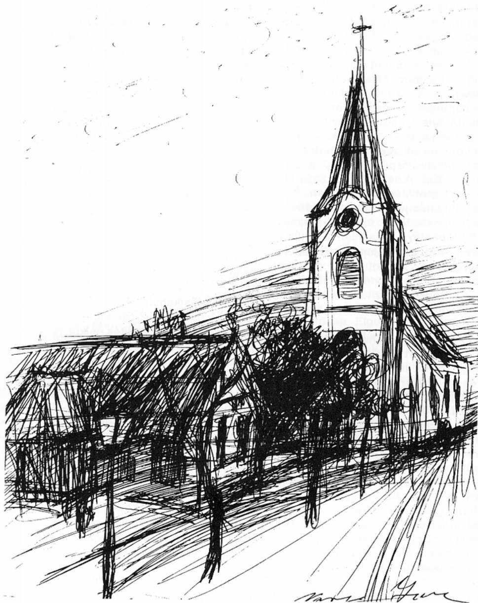
1. kép. Templom és piactér a XVIII. században (Varga Imre szobrászművész rekonstrukciós rajza, 1993.)

Az orgona 1779-ben négyváltozatú volt. Feljegyzések szerint ekkor már nagyon régi és hiányos volt. Gyóntatószék nem volt. A hívek gyónásukat a sekres-