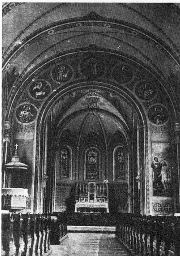
2. kép. A siófoki templom 1938-ban

A lelkipásztort a templomépítésben hívei páratlan lelkesedéssel és áldozatkészséggel segítették; még a legszegényebbek is buzgón adakoztak. 82 Egyidejűleg a templom sok és nagyértékű edény- és ruha