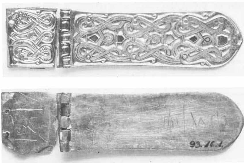
6. kép. A nagyszíjvég elő- és hátlapja (Zamárdi avar temető, 1270. sz. sír)