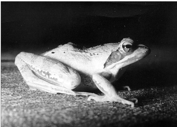
8. kép: Erdei béka / Rana dalmatina / éjszakai vedészeton.

Természetvédelmi teendőink: mindkét „barna béka” fajunk állománycsökkenésének megakadályozása érdekében szaporító-vizeiknek fenntartása, megőrzése.