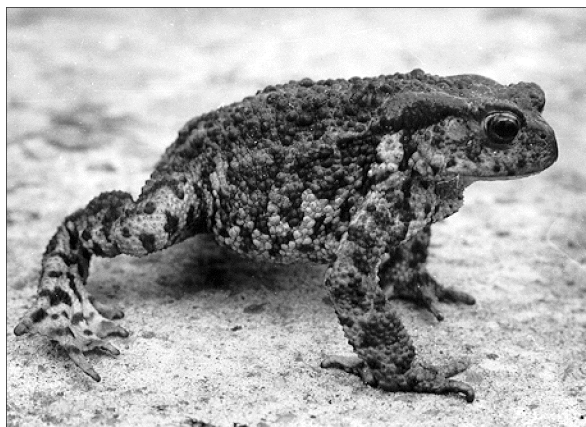
7. kép: Barna varangy / Bufo bufo / védekező állásban

Photo 7.: Brown toad in a defensive position