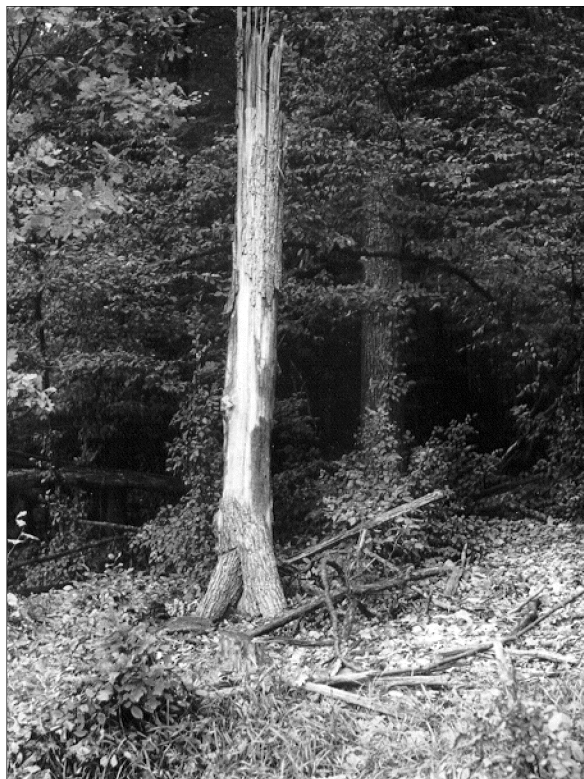
10. kép: A kiszáradó öreg fák kérge alatt rejtőznek a fali gyíkok.

Magyarország hegy- és dombvidékein szigetszerűen elszórt foltokban élnek populációi. A Zselicben eddig csak a táj középső részéből került elő. 1985. évi itteni fölfedezése meglepetésként hatott, mert herpetológiai irodalmunk, mindezidáig, a Dél-Dunántúlról csak a Mecsek-hegységből tartotta számon. A Zselic herpetofaunájának egyik jellemző faja.