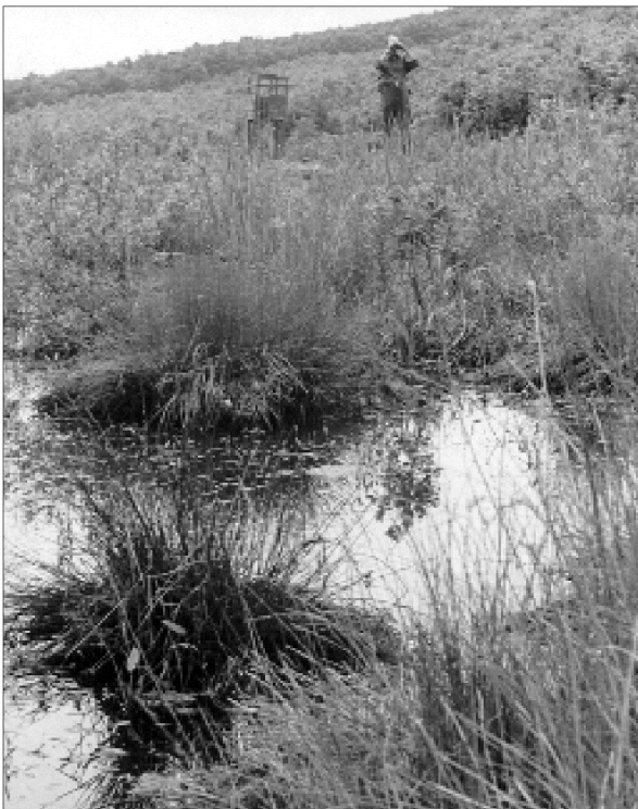
2. kép: Zsombékos. Gőte és béka fajok élőhelye. Photo 2.: Clump in marsh, habitat of the tritons and the species of frogs.