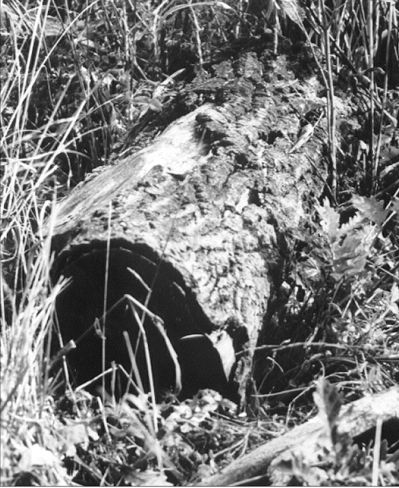
11.kép: A farönkök lehámló kérge alatt talál búvóhelyet a fali gyík /Podarcis muralis/. Photo 11.: The wall lizard find its hiding place under the exfoliating barks of tree trunks.

Élőhelyei a melegebb klímához kötöttek. Ezen belül azonban éppúgy előfordul száraz, köves, napos terepen, mint hegyek, dombok patakjainak nedves partjain. Kultúra-követő faj: kertekben, parkokban is megtelepszik (Engelmann 1985).