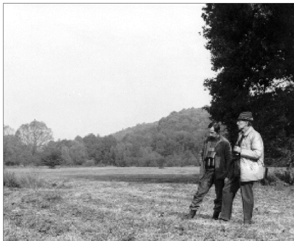
4. kép: Rét. Gyíkfajok és rézsíkló élőhelye.

Photo 4.: The meadow, habitat of species of lizards and the smooth snake.