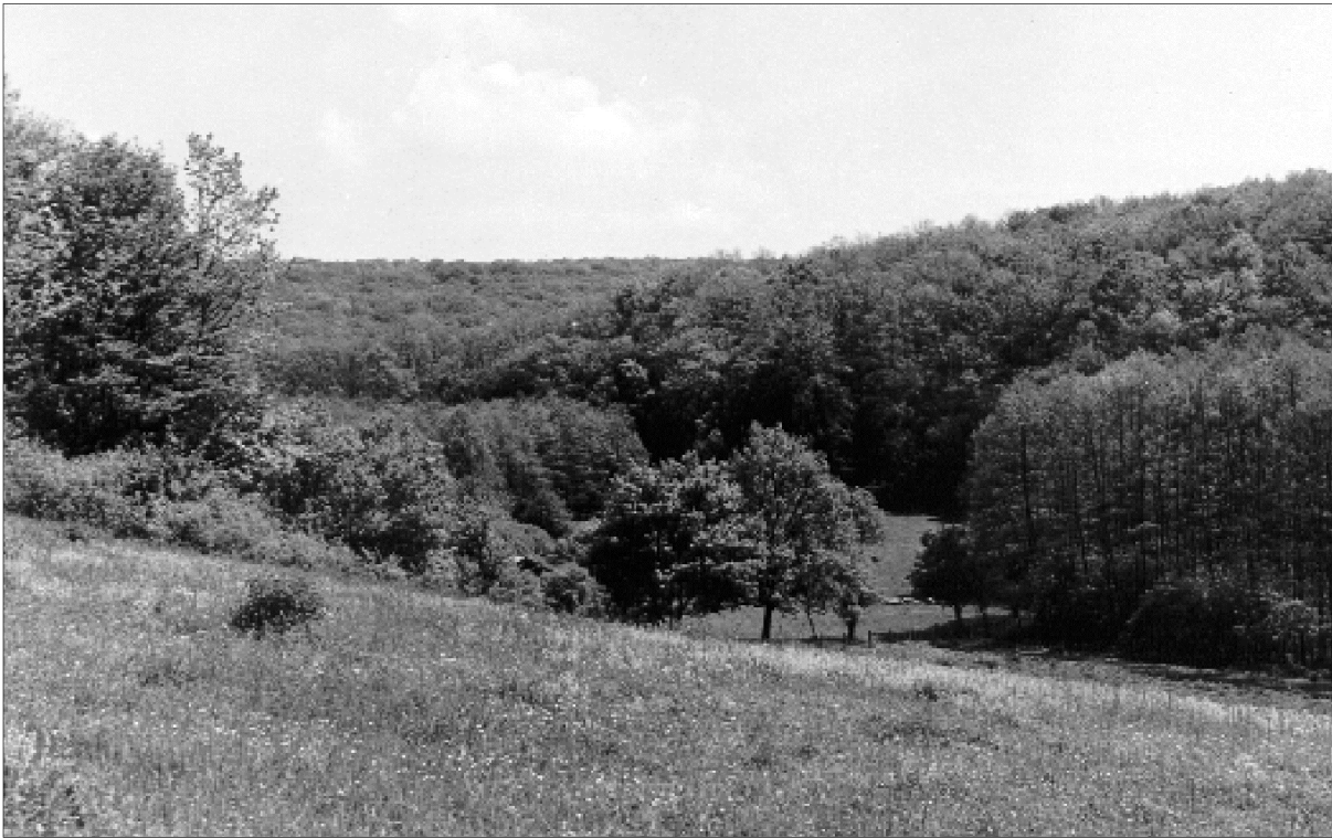
1. kép: A dimbes-dombos, erdővel borított Zselic. Photo 1.: The undulating Zselic, covered with forests.