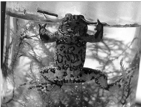
6. kép: Sárgahasú unka / Bombina variegata /.

elvadult halastó (Zselickisfalud): 1985.05.26. - Mátyás király-kút, Denna-erdő (Bárdudvarnok) sekély vízfolyás: 1983.09.05. - útmenti pocsolyában és kocsinyom vizében: 1984.05.11.- időszakos vízállásban: 1985.05.24. - Vörösdomb, Enezdi-oldal (Zselic-kisfalud): útmenti pocsolya: 1986.05.15.