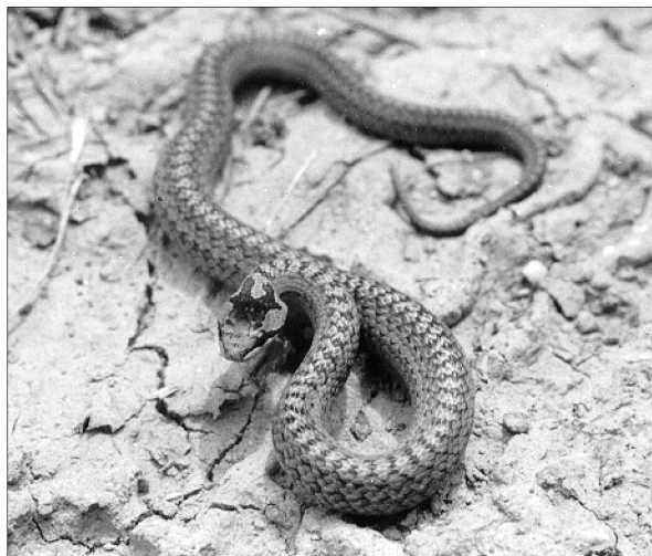
12. kép: Rézsikló / Coronella austriaca /. Photo 1.: Smooth snake.

Lelőhelyei: Bergyóka-oldal, Dennai-erdő (Szilvásszentmárton): elhagyott kútban: 1985.10.19. - Lipótfá (Bárdudvarnok): földúton, juv. pld.: 1986.05.15. - Vörös.-domb: tölgyesben erdei úton: 1987.05.15.