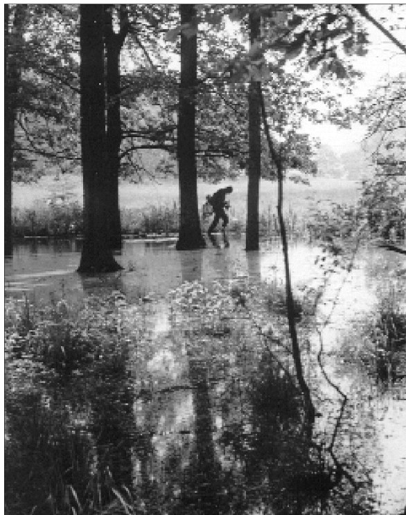
3. kép: Időszakos vízállás. Gőte és béka fajok tavaszi tartózkodási helye. Photo 3.: Temporary water-level. Spring habitstion of the species of tritons and frogs.