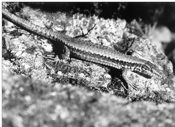
9. kép: Fali gyík / Podarcis muralis /. Photo 9.: Wall lizard / Podarcis muralis /.

Lelőhelyei. Vörös-domb (Zselickisfalud): Vitorági-oldal, erdei irtás: 1985.05.26. - Vörös-domb (Zselickisfalud) Enyezdí-oldal, erdei kunyhó cserepes tetején: 1985.05.26. - Vörös-domb: 1985.10.20. -1986.05.20. -